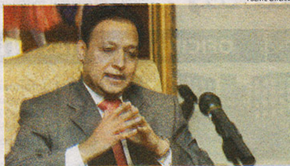
Abel Martínez, presidente de la Cámara de Diputados.

ducen luego de recibir una delegación de la Comisión Interamericana de los Derechos Humanos (CIDH), a quienes junto a los voceros de los partidos, les pidió detener la campaña internacional que lleva a cabo el gobierno de Haití contra la el país. Martínez explicó que en la reunión primó un diálogo firme respecto a la sentencia del TC. *