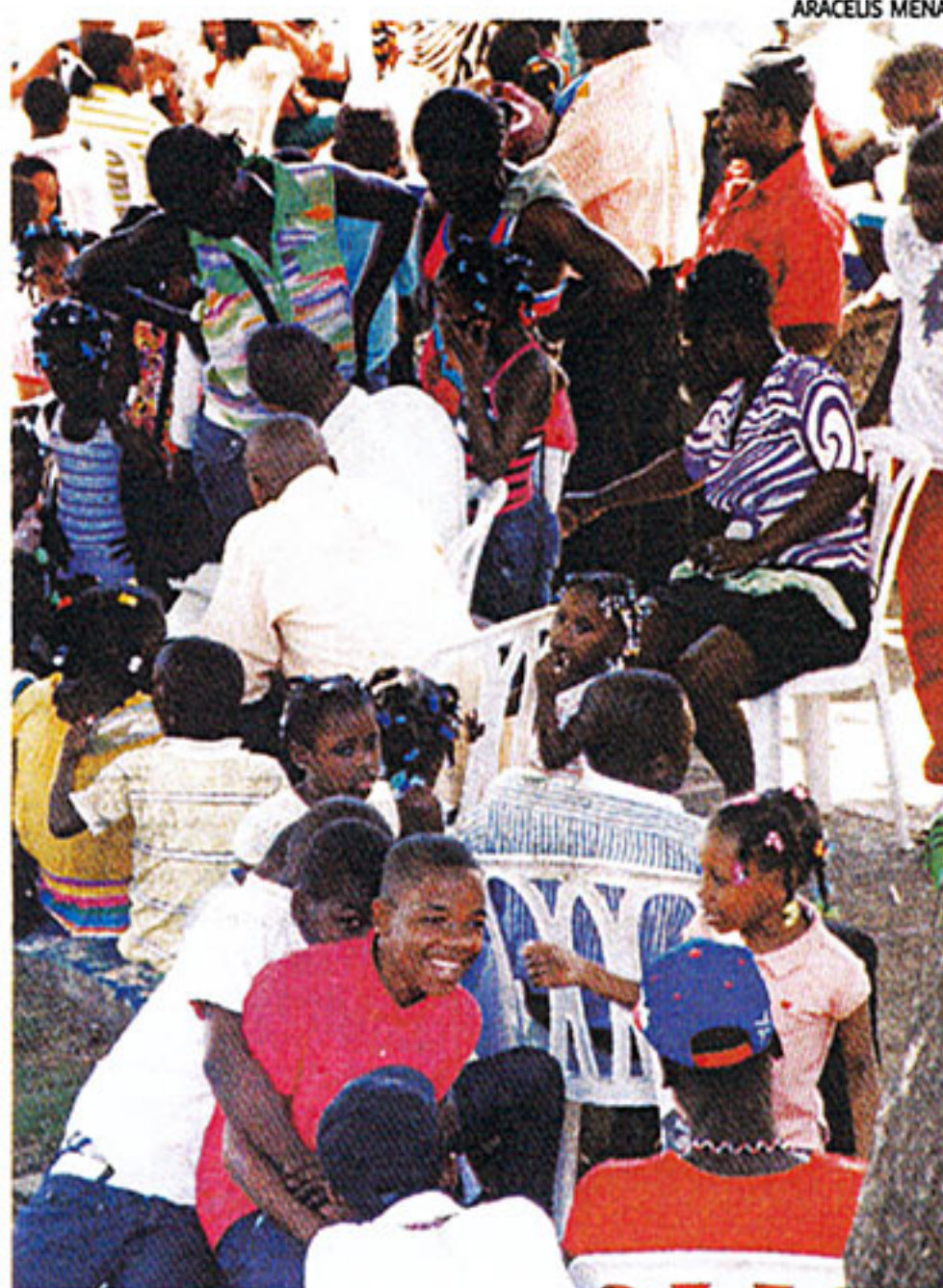
Estos niños, muchos sin declarar, ríen ajenos al drama que viven.

Los receptores de las denuncias en el club de pro-