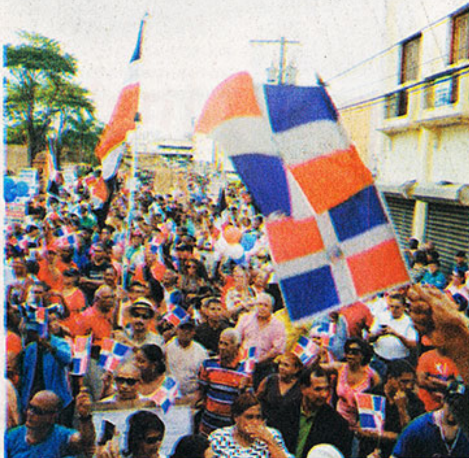
La Red Nacional por la Defensa de la Soberanía ha realizado varias jornadas patrióticas en el país en defensa del fallo del TC.

Expresa que el país no es objeto de su fiscalización ni de ninguna de las funciones establecidas en su marco jurídico, por lo que carece de calidad, autoridad y legitimidad para actuar de manera oficial en República Dominicana. En ese sentido,