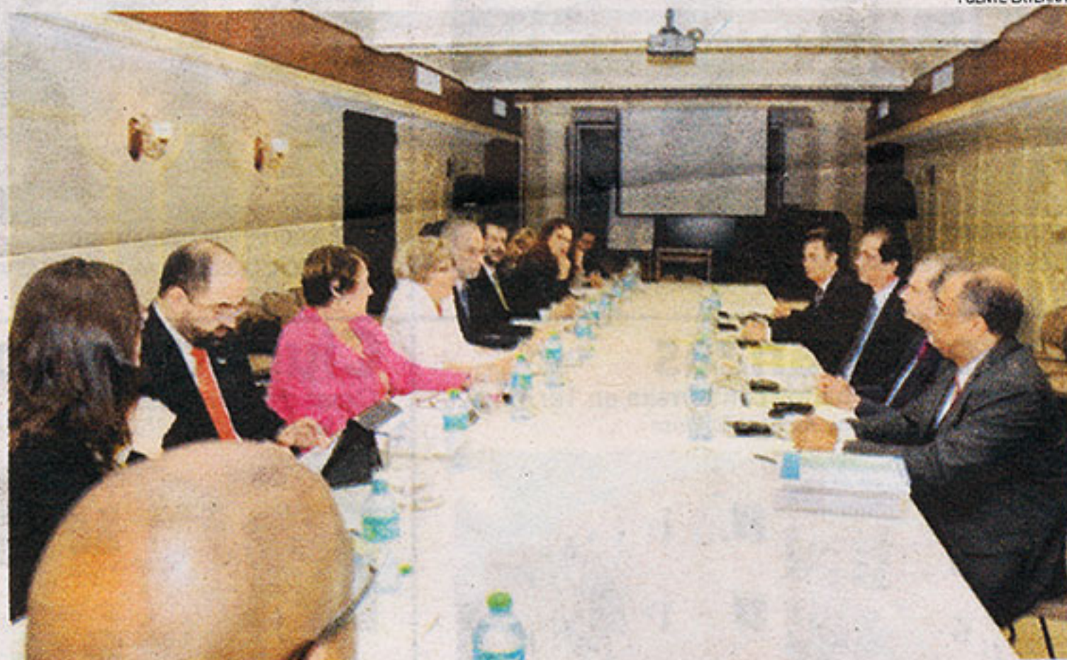
Miembros de la Comisión Interamericana de Derechos Humanos se reunieron con el Gobierno.

En esa publicación, el CIDH expresó que la Sentencia 168-13 del TC es violatoria a los acuerdos internacionales de derechos humanos y pone en entredicho la voluntad del Estado dominicano de atender sus