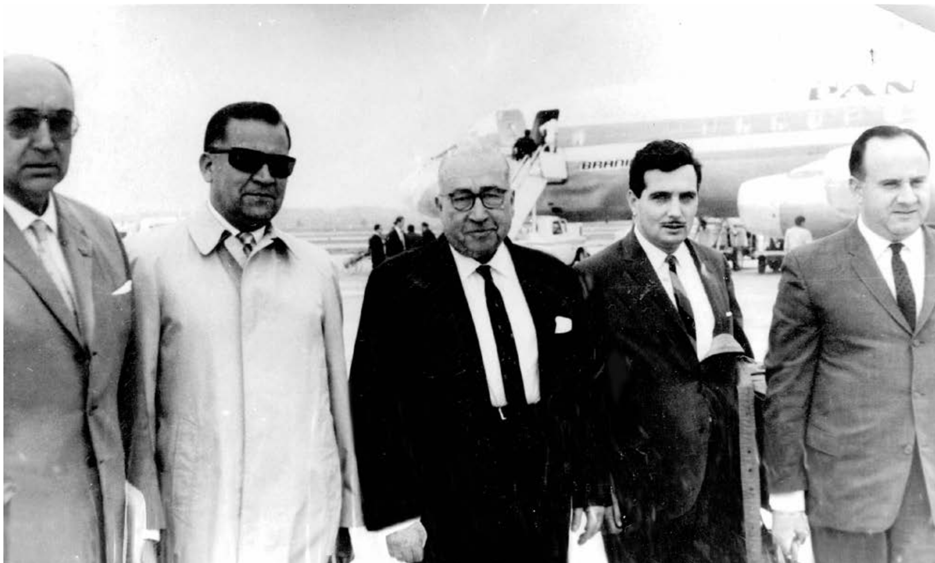
Periodo extraordinario de sesiones en Santiago de Chile, 1967