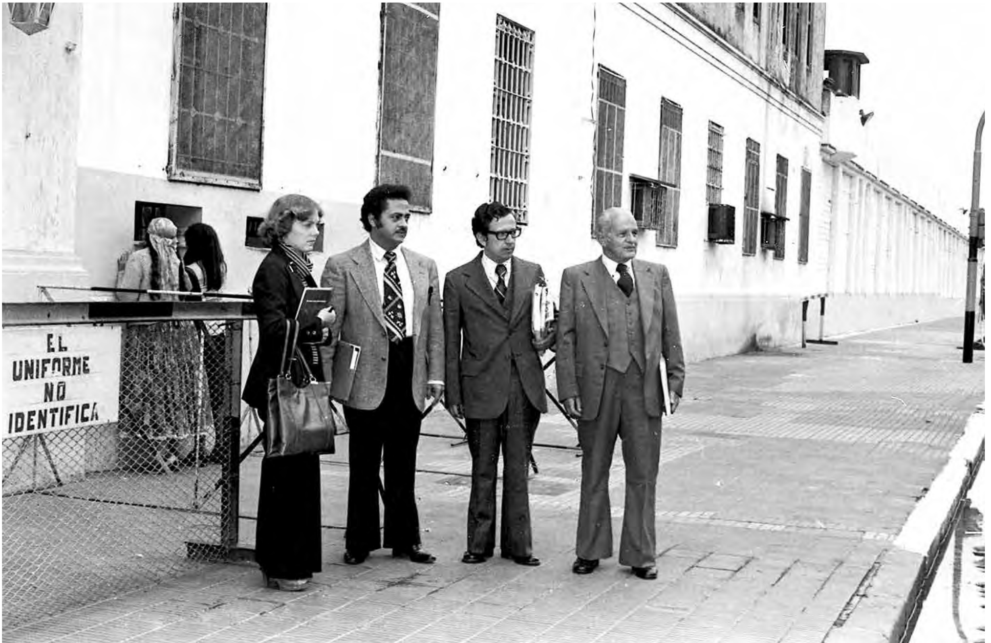
Visita in loco a Argentina, 1979