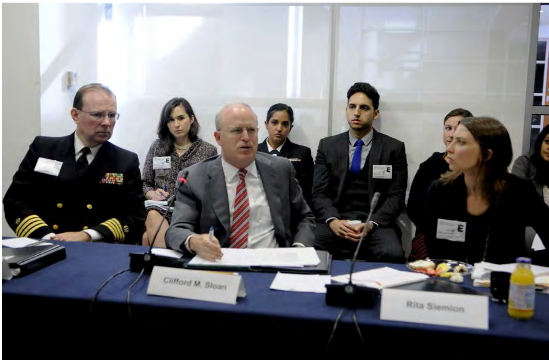
Reunión de expertos sobre Guantánamo, 2013