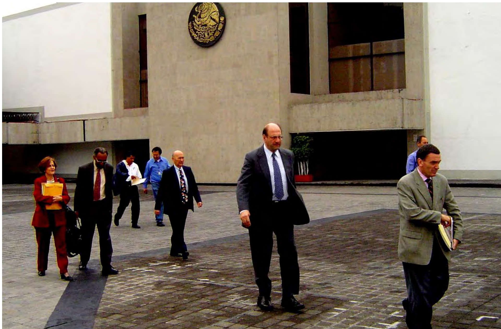
120º periodo extraordinario de sesiones en México, 2004