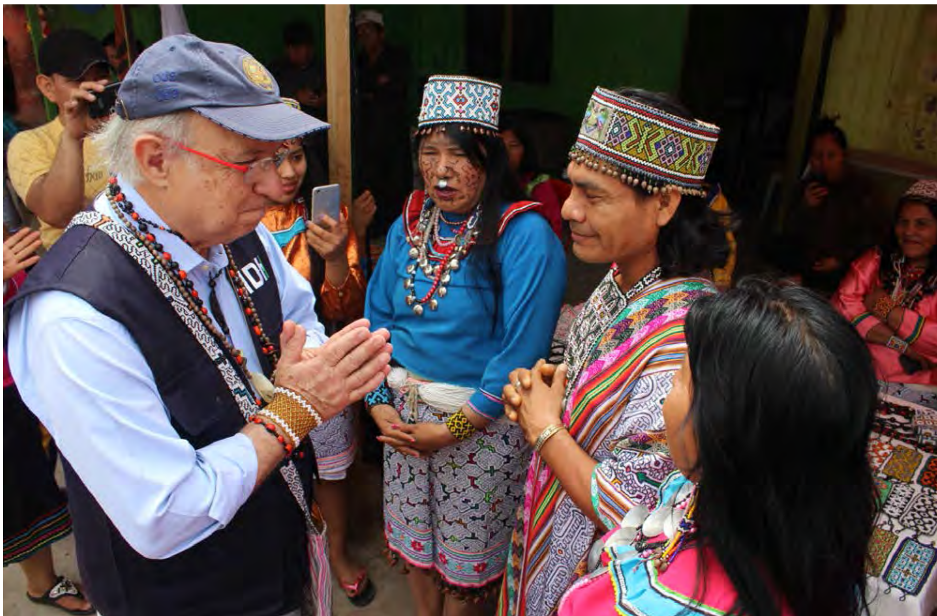
Visita a Perú, 2016