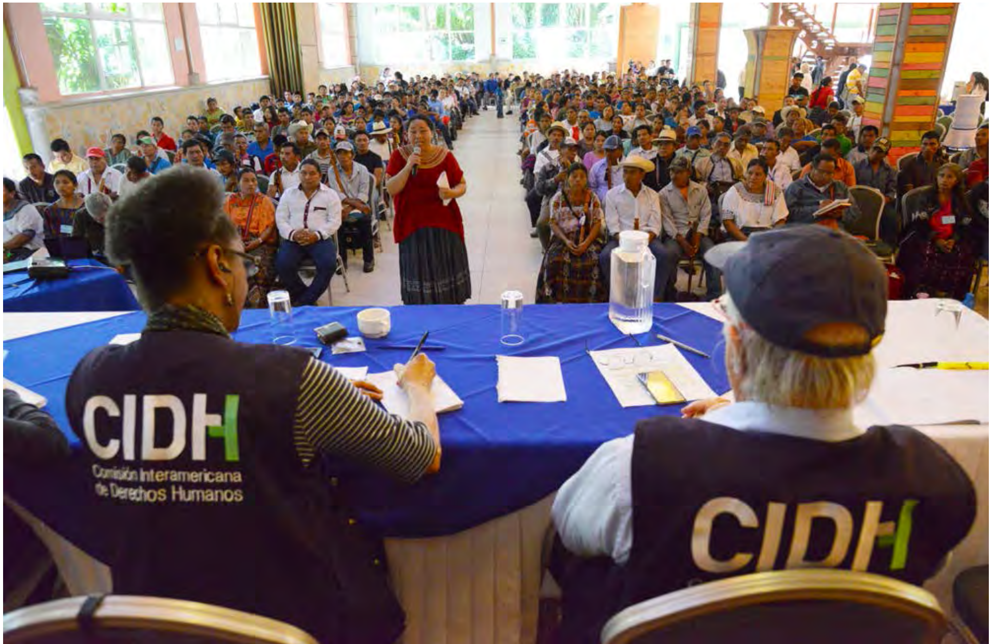
Visita in loco a Guatemala, 2017