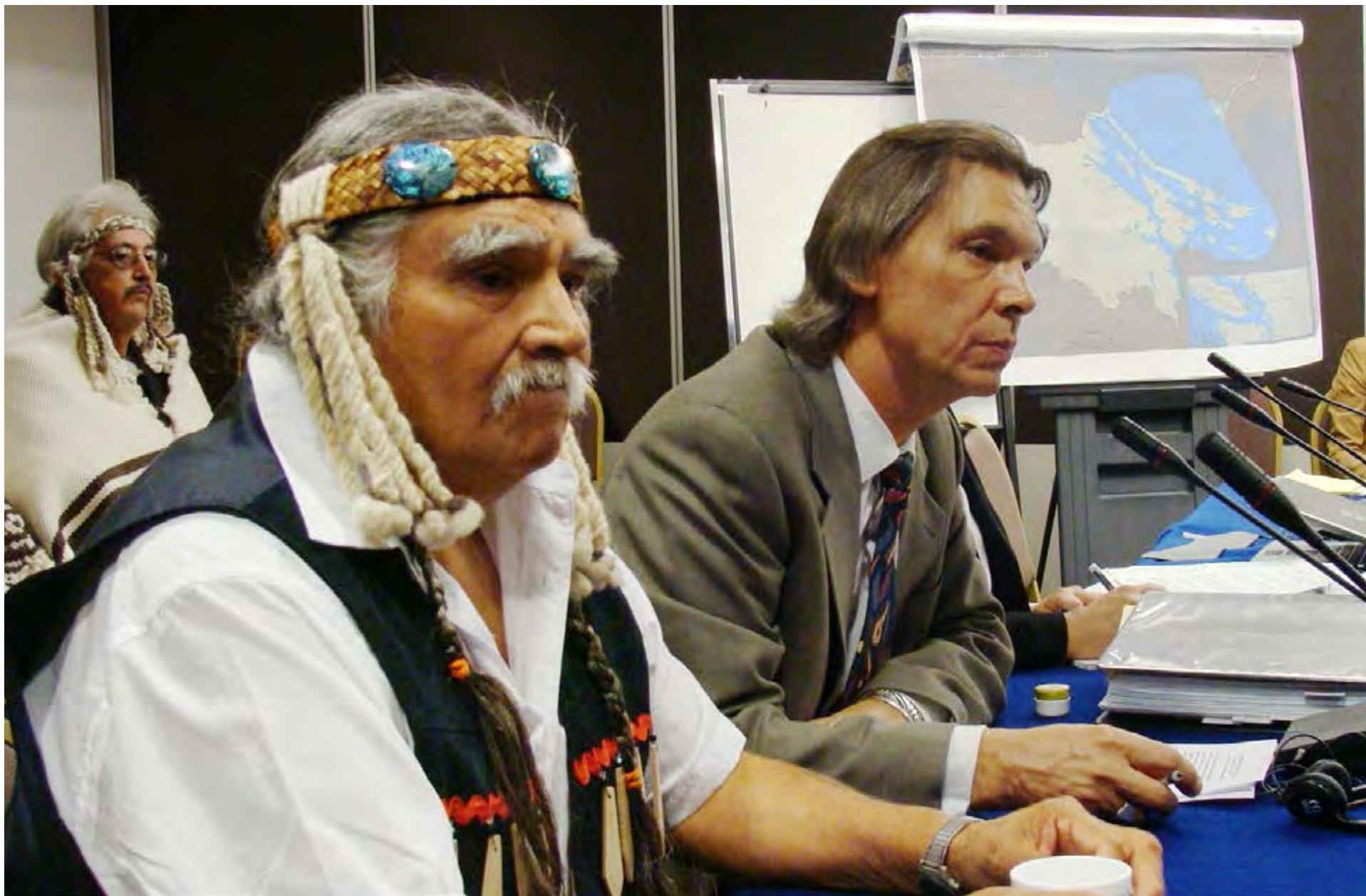
Audiencia del Caso del Grupo del Tratado Hulq'umi'num, Canadá, 2008