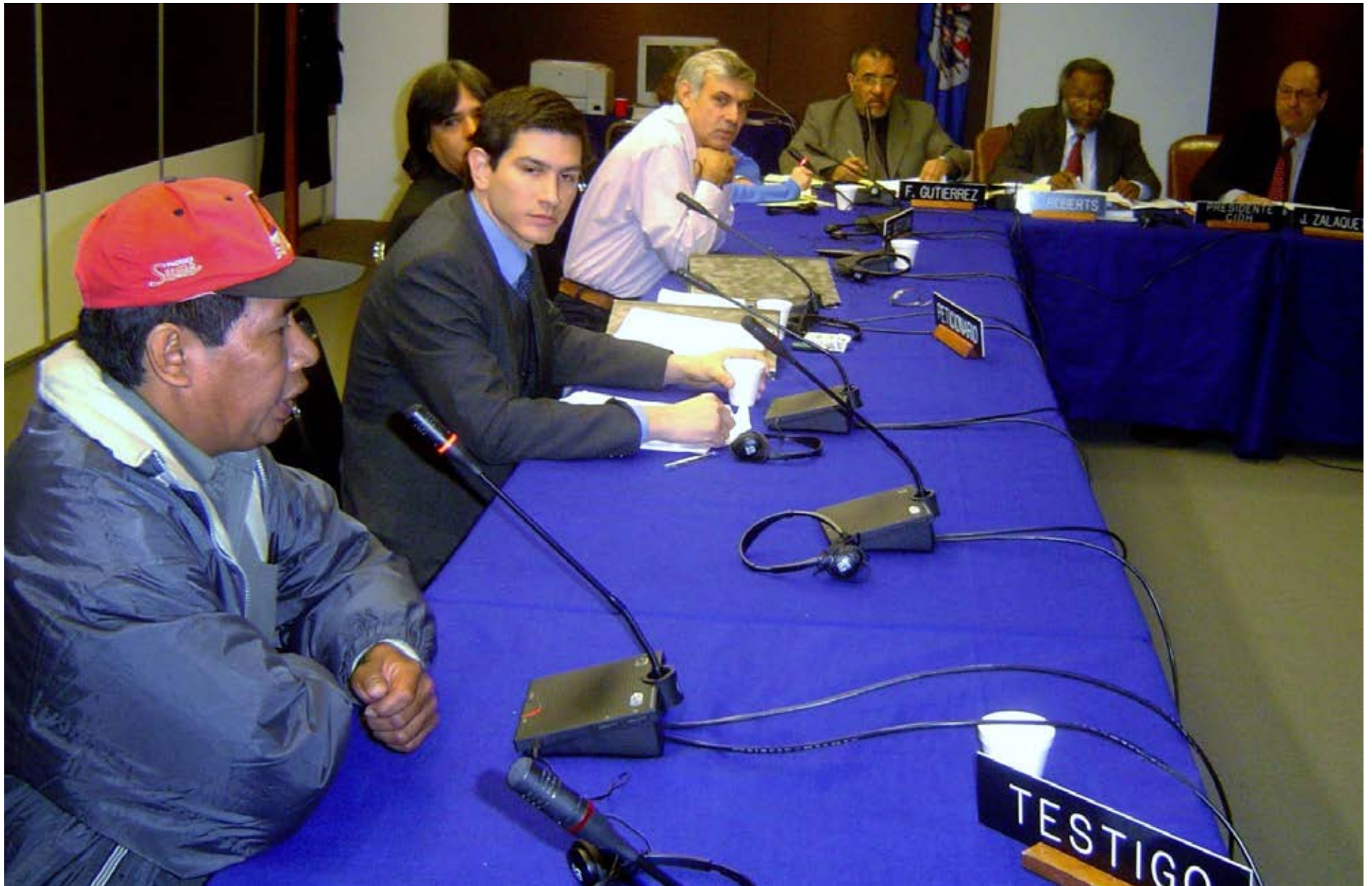
Audiencia en el Caso de la Comunidad Indígena Sawhoymaxa de Paraguay, 2004