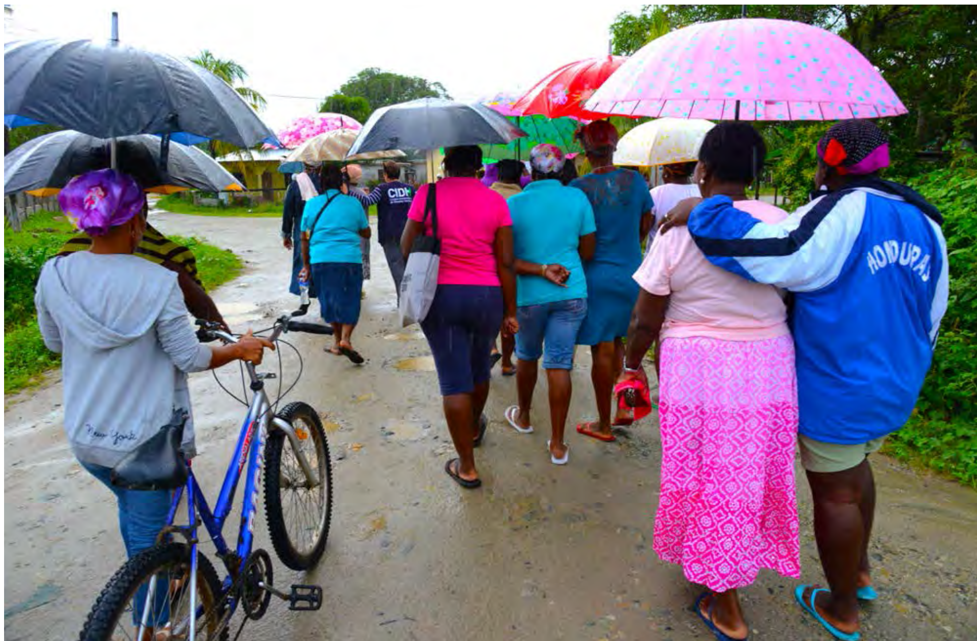
Visita in loco a Honduras, 2014