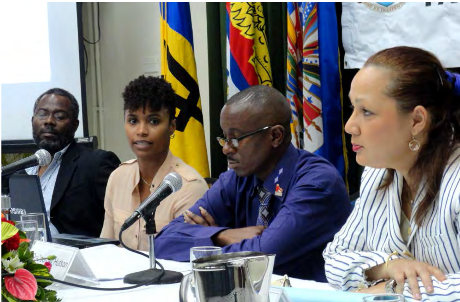
Foro sobre estigma y discriminación basados en orientación sexual e identidad de género en el Commonwealth del Caribe, Barbados, 2012