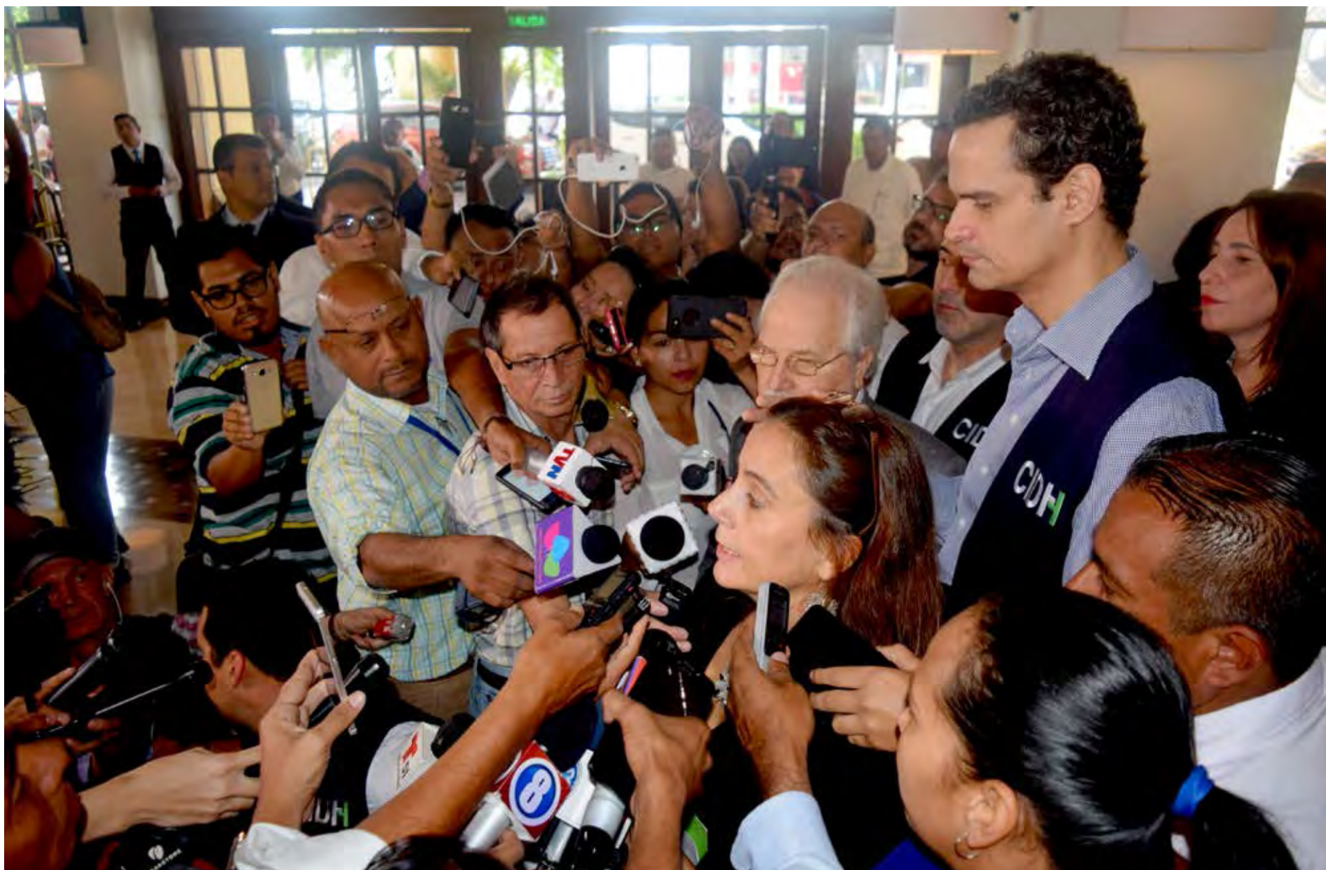
Visita de trabajo a Nicaragua, 2018