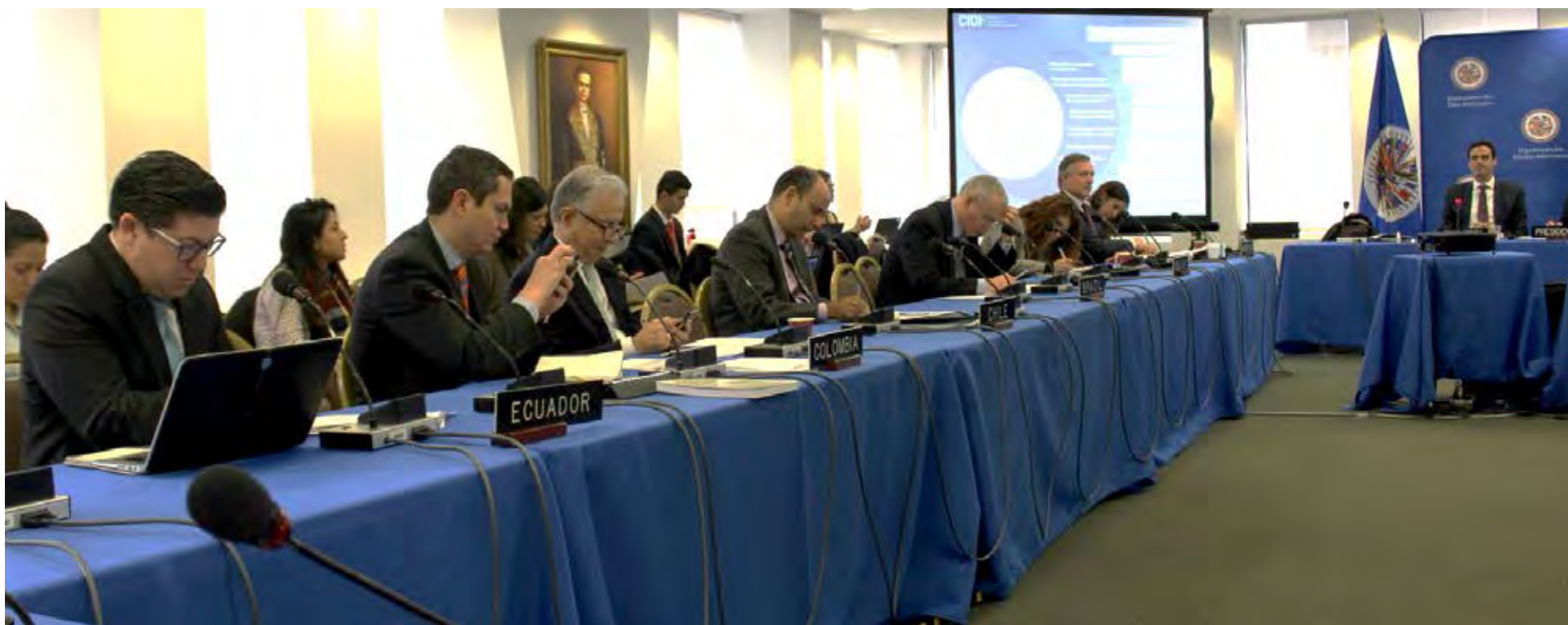
Consulta sobre el Plan Estratégico, 2017