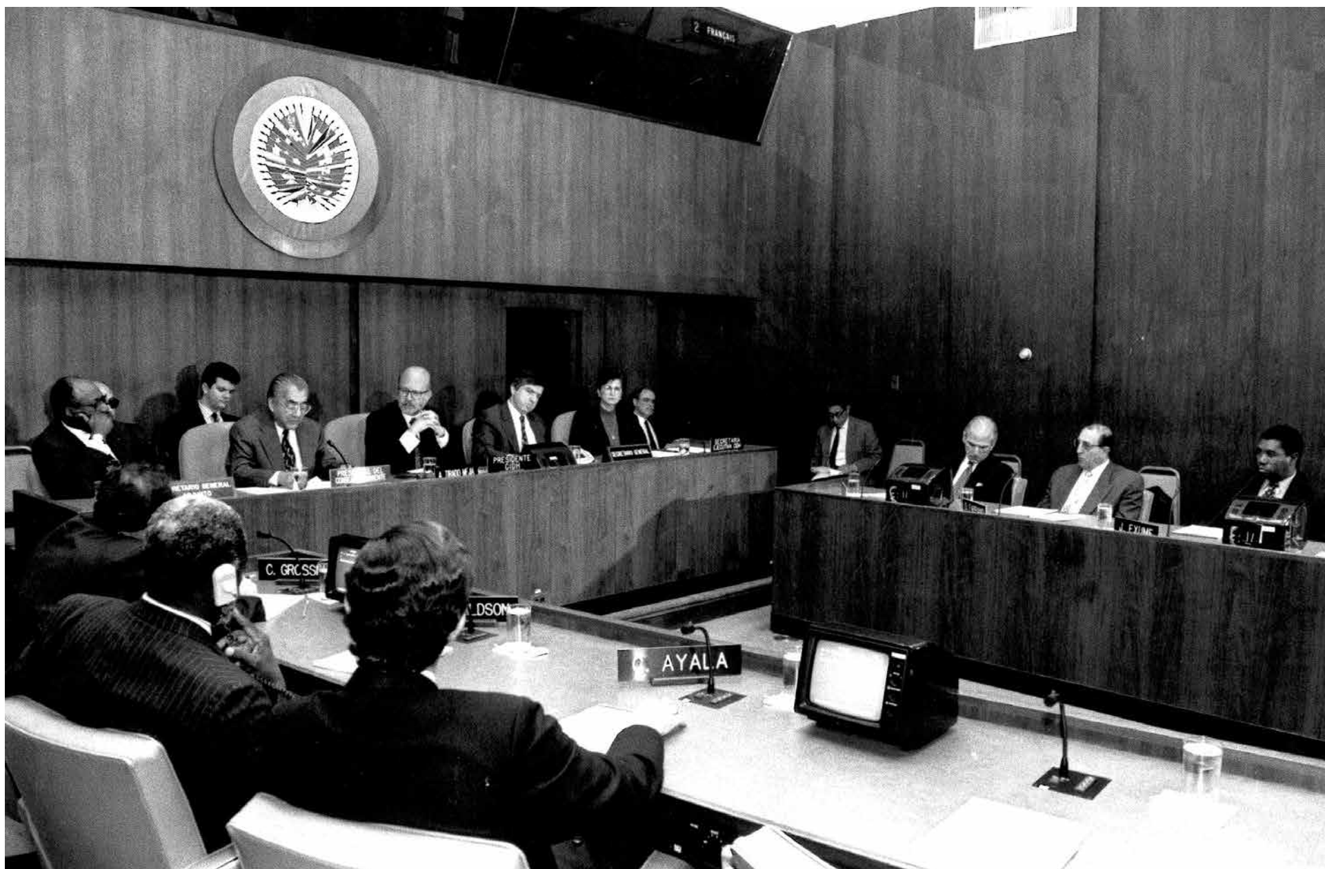
91º periodo ordinario de sesiones en Washington, D.C., 1996