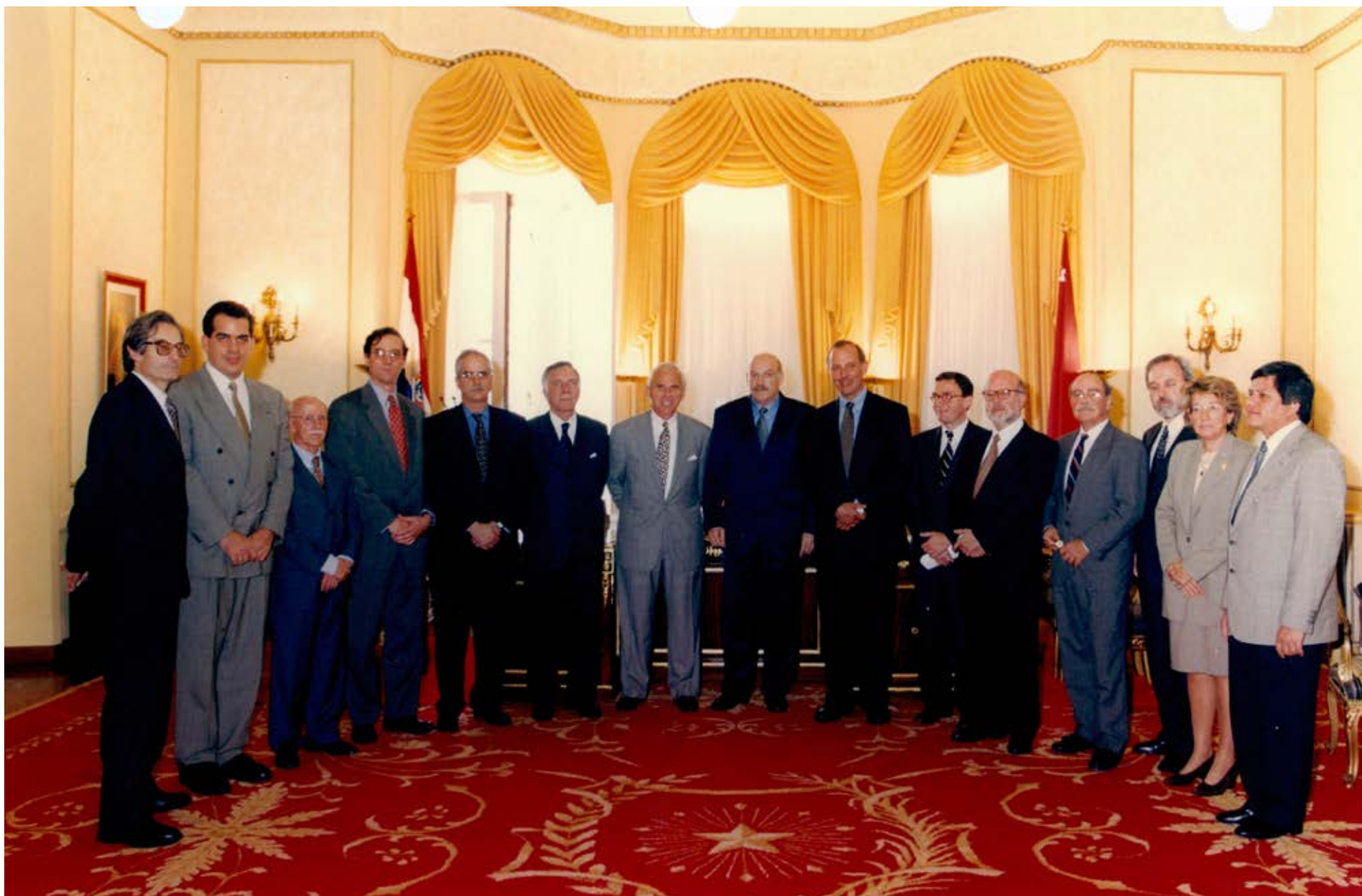
Visita in loco a Paraguay, 1999