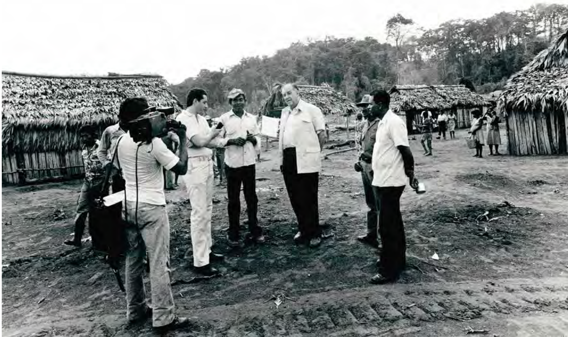
Visita in loco a Nicaragua, 1980