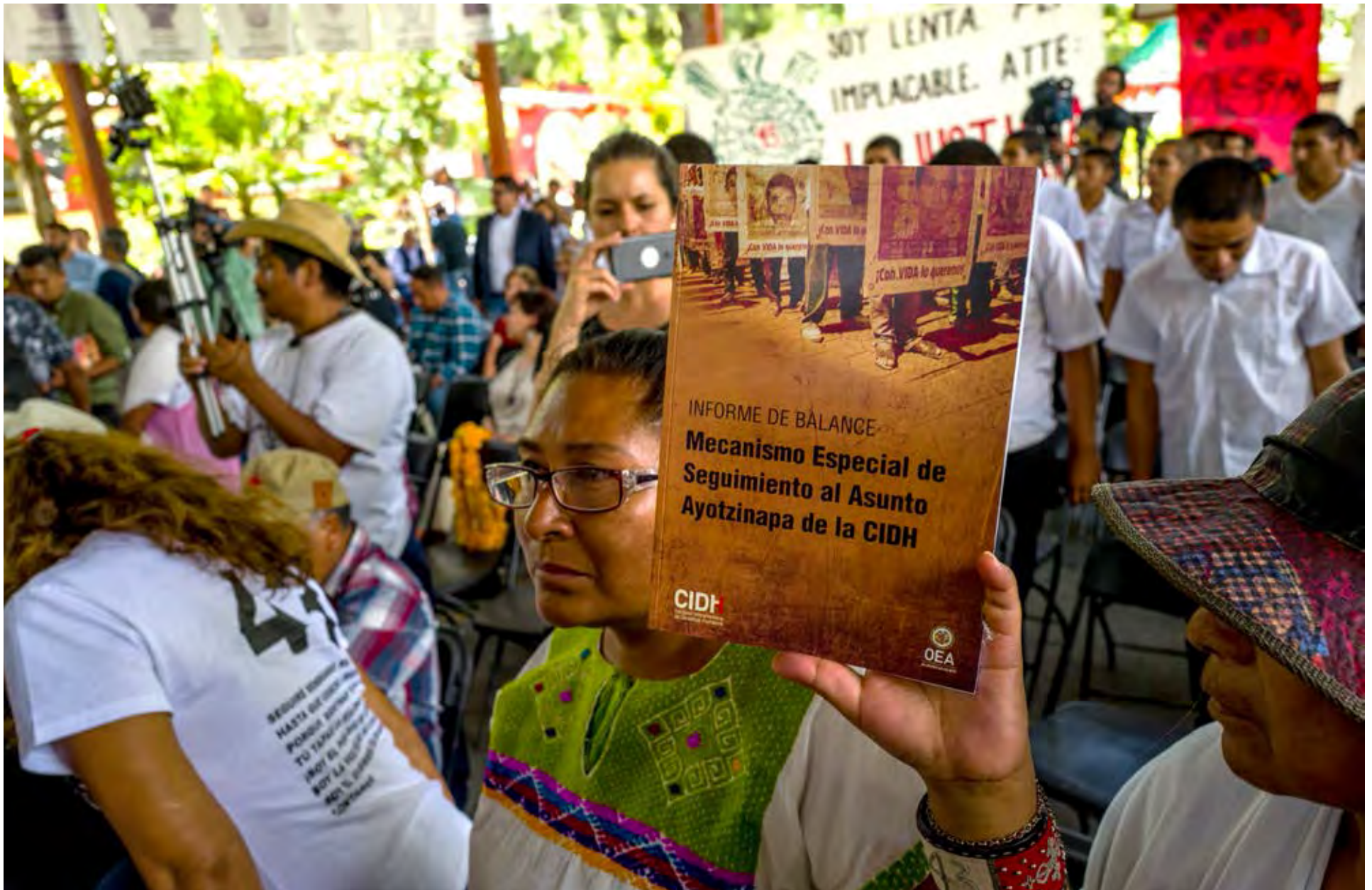
Visita del MESA a México, 2018