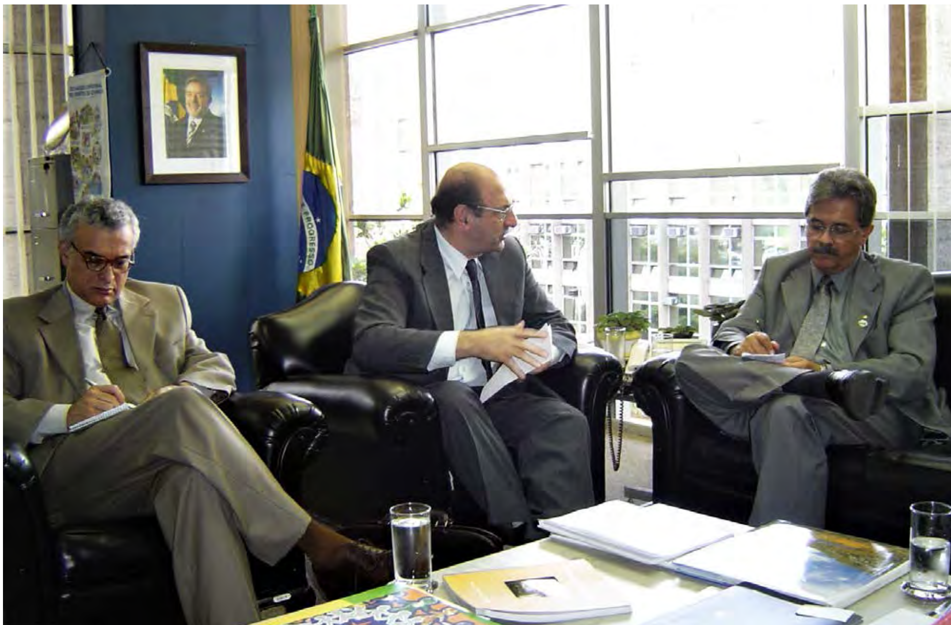
Visita de trabajo a Brasil, 2003