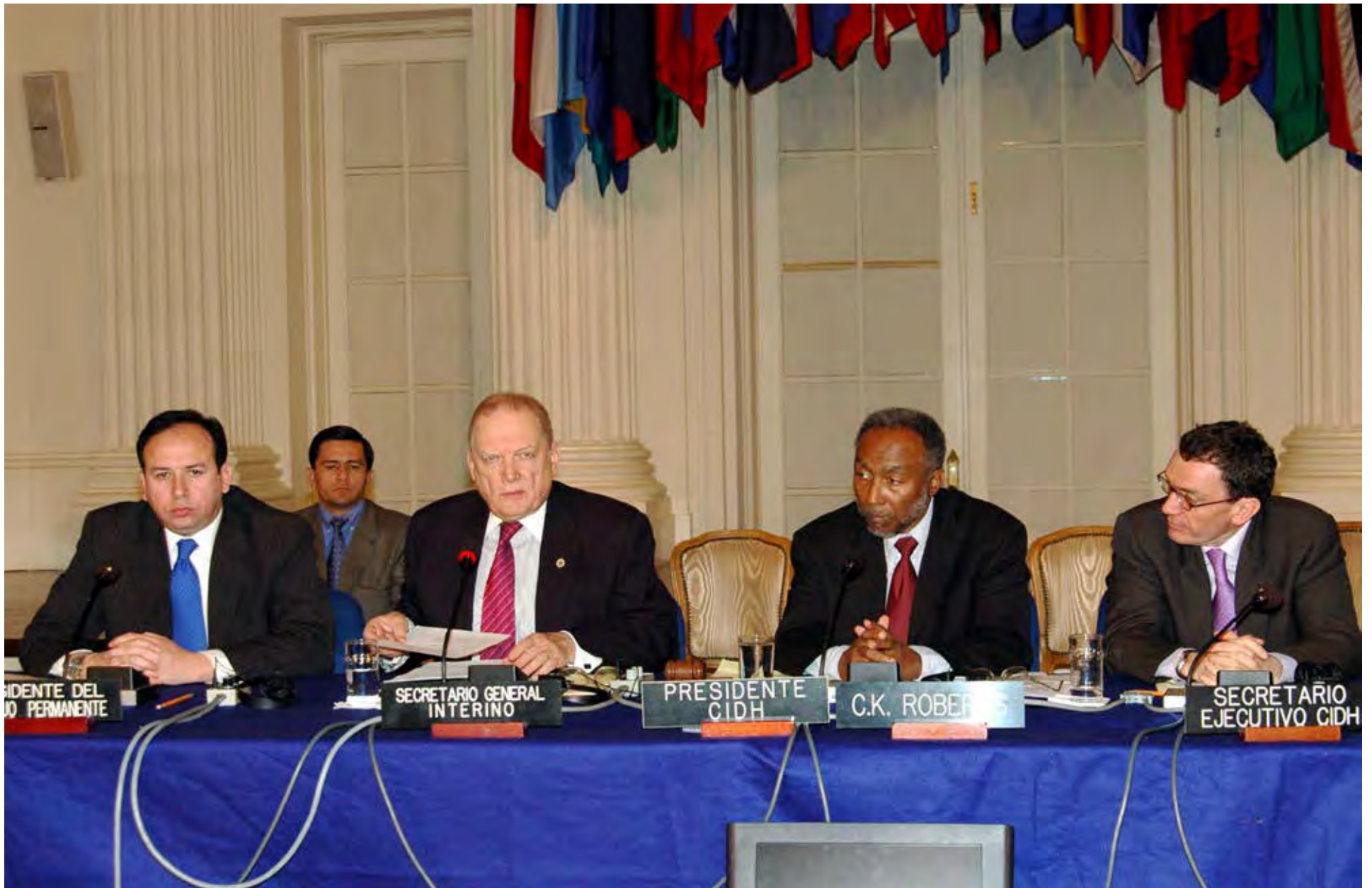
122º periodo ordinario de sesiones, Washington, D.C., 2005