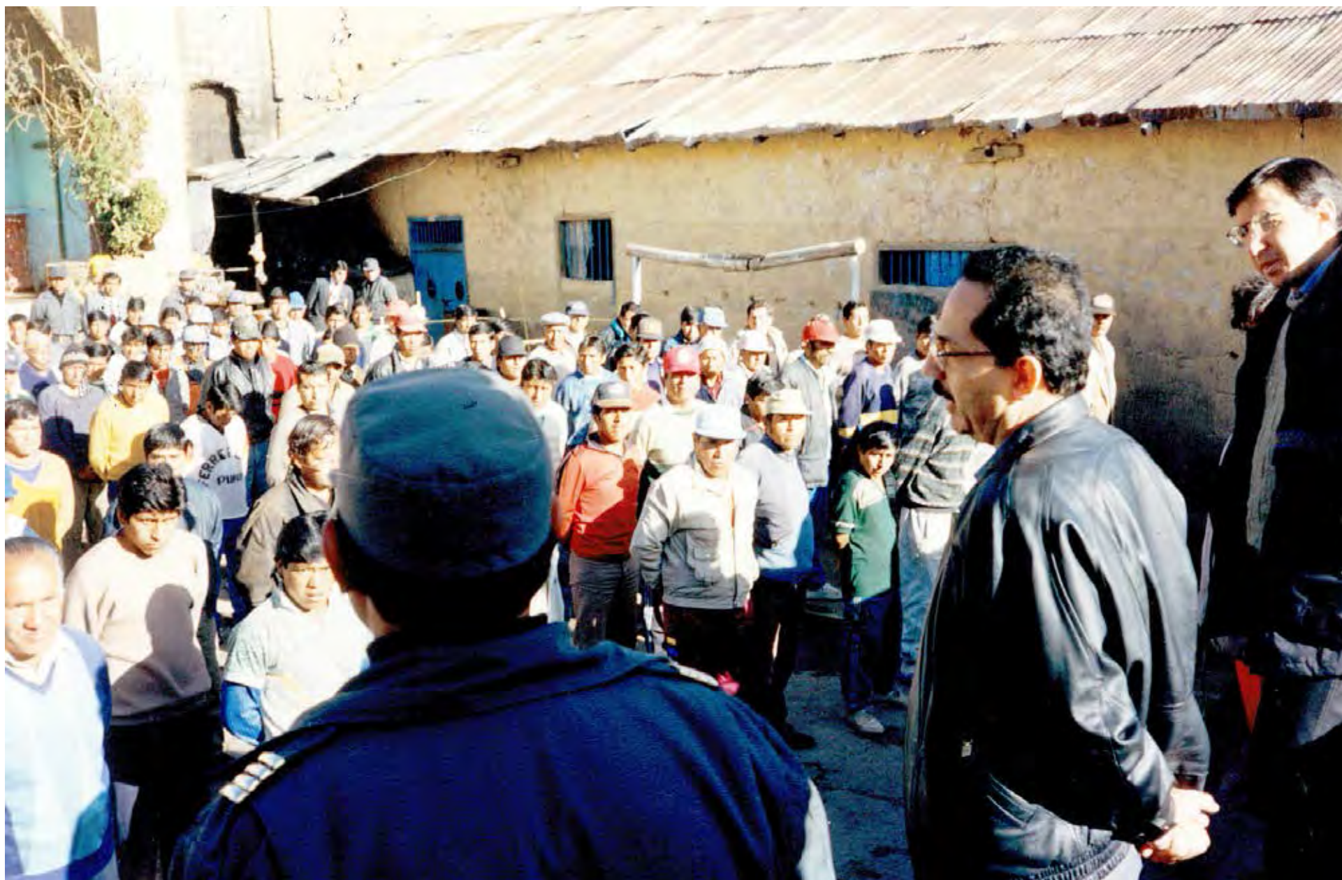
Visita in loco a Perú, 1993