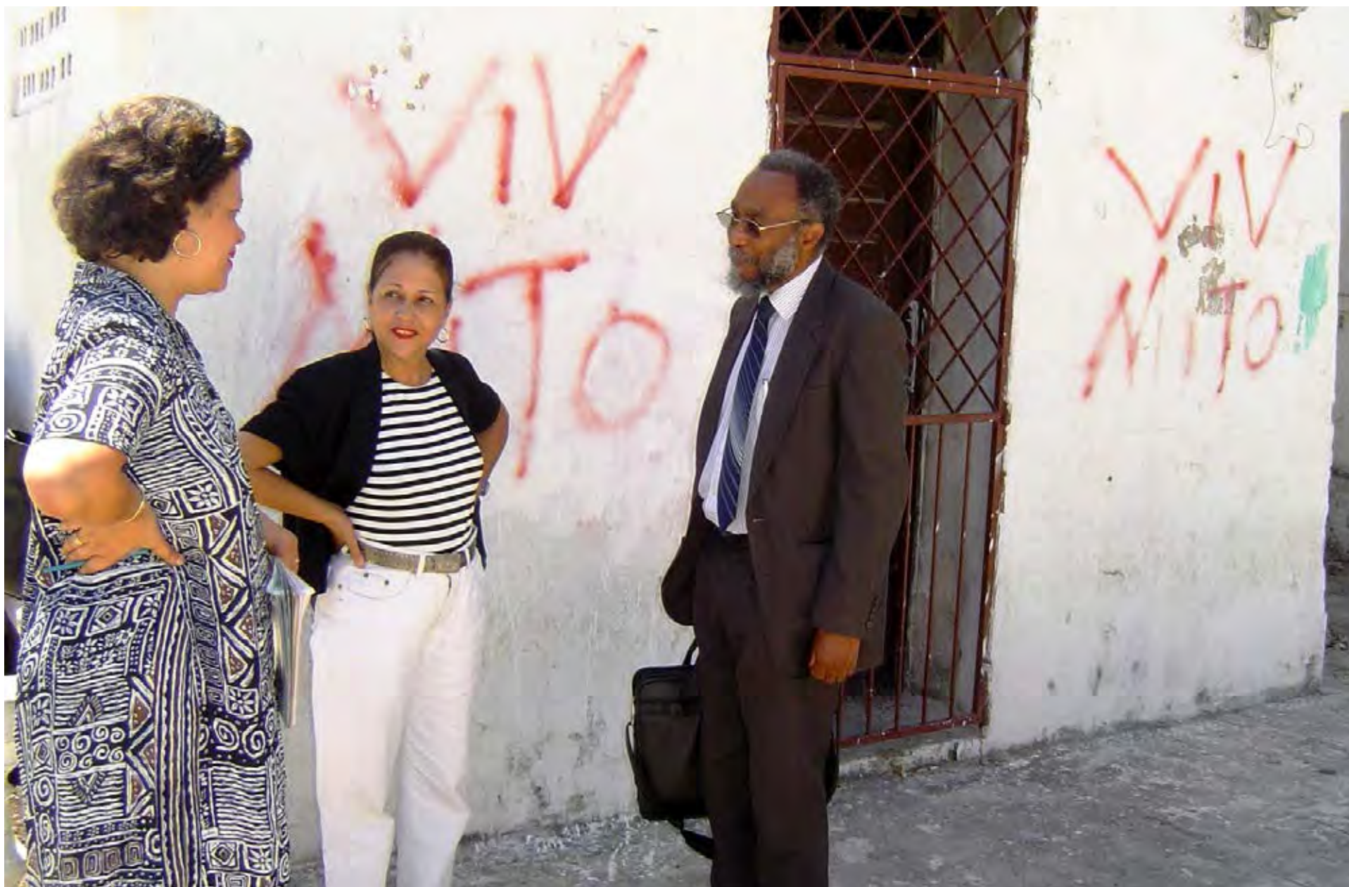
Visita de trabajo a Haití, 2003