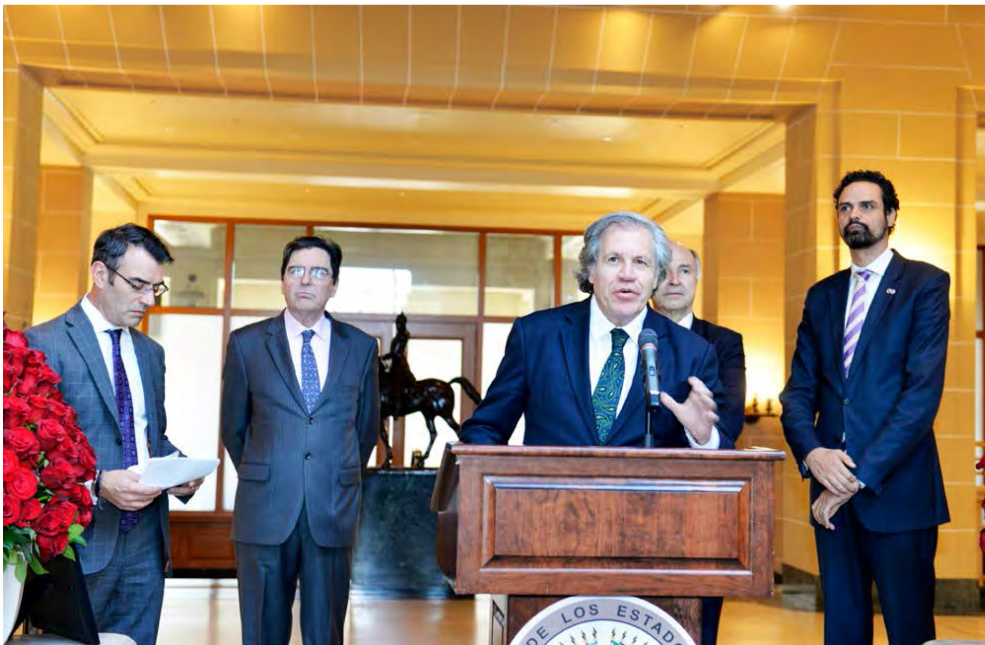
Presentación del informe sobre estándares de movilidad humana, 2016