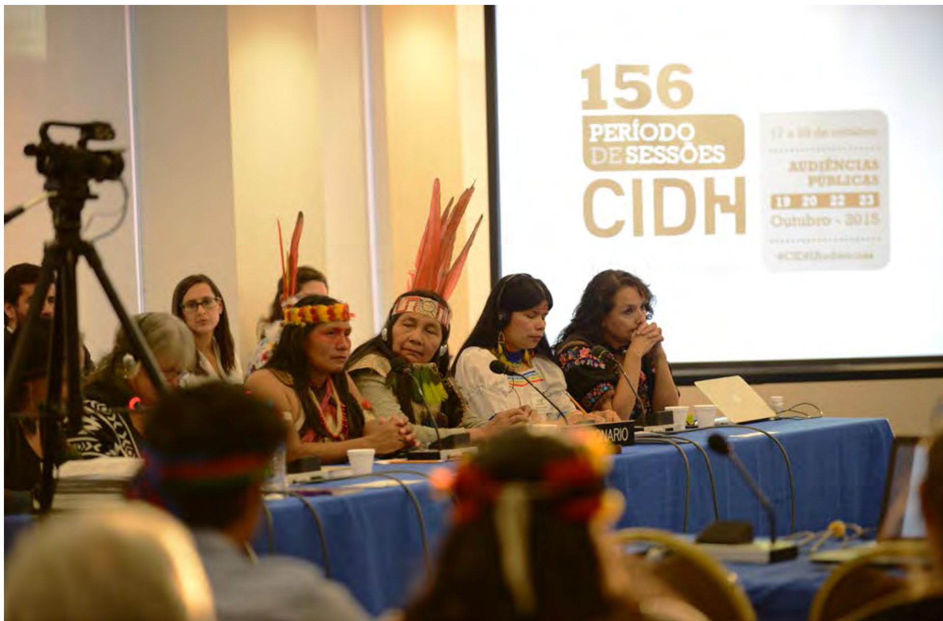
Audiencia del Caso 12.979 - Pueblos Tagaeri y Taromenani, Ecuador, 2015