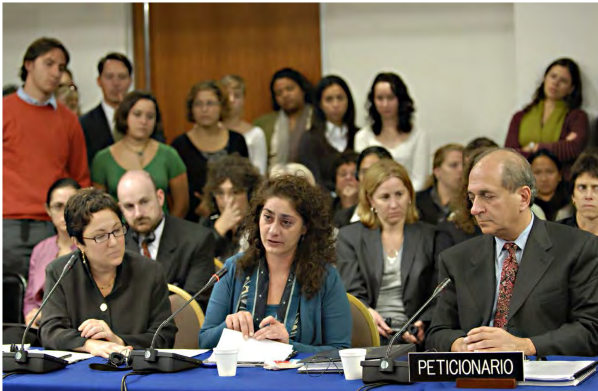
Audiencia del Caso Jessica Gonzales, Estados Unidos, 2008