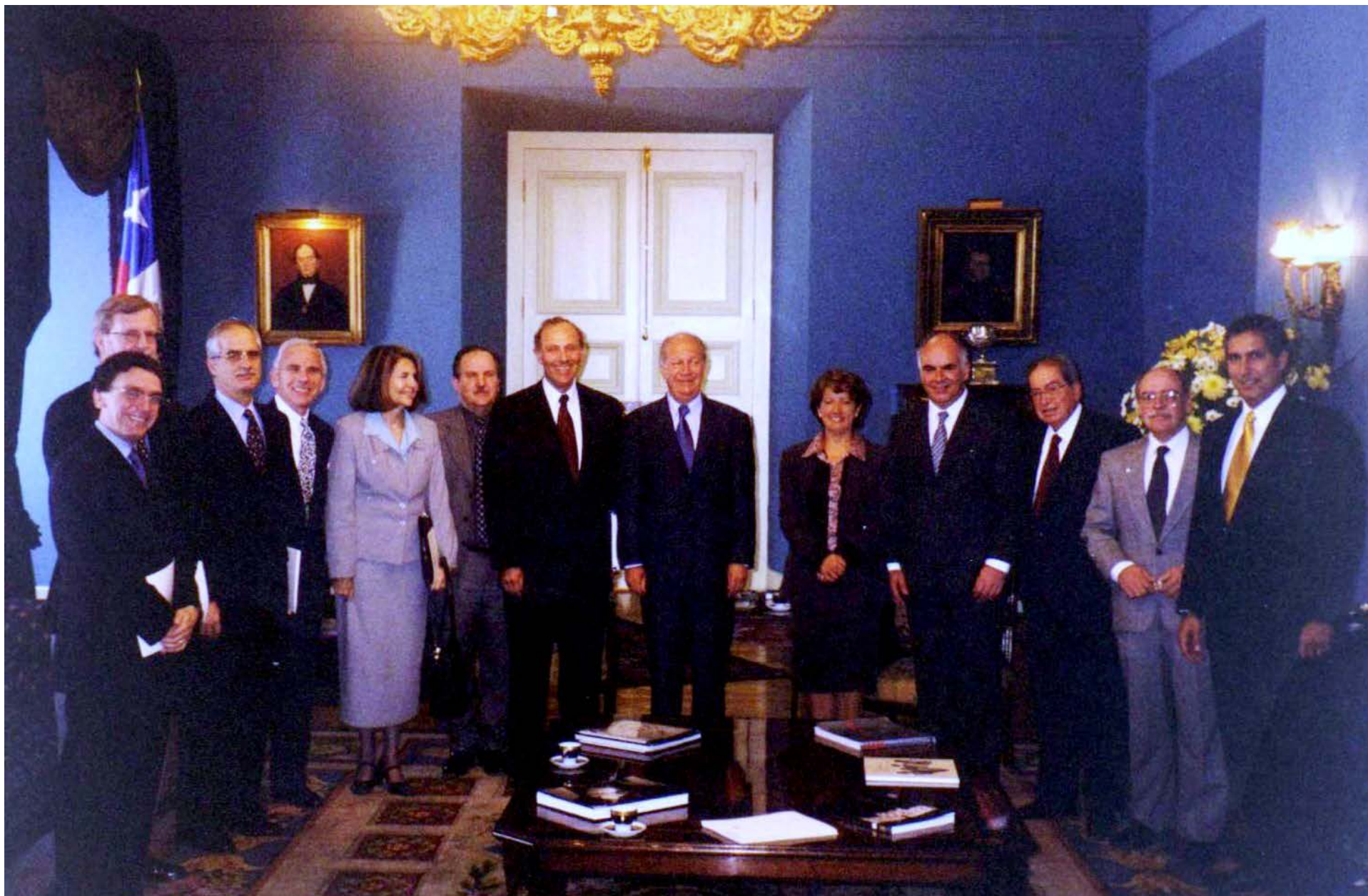
111º periodo extraordinario de sesiones en Chile, 2001