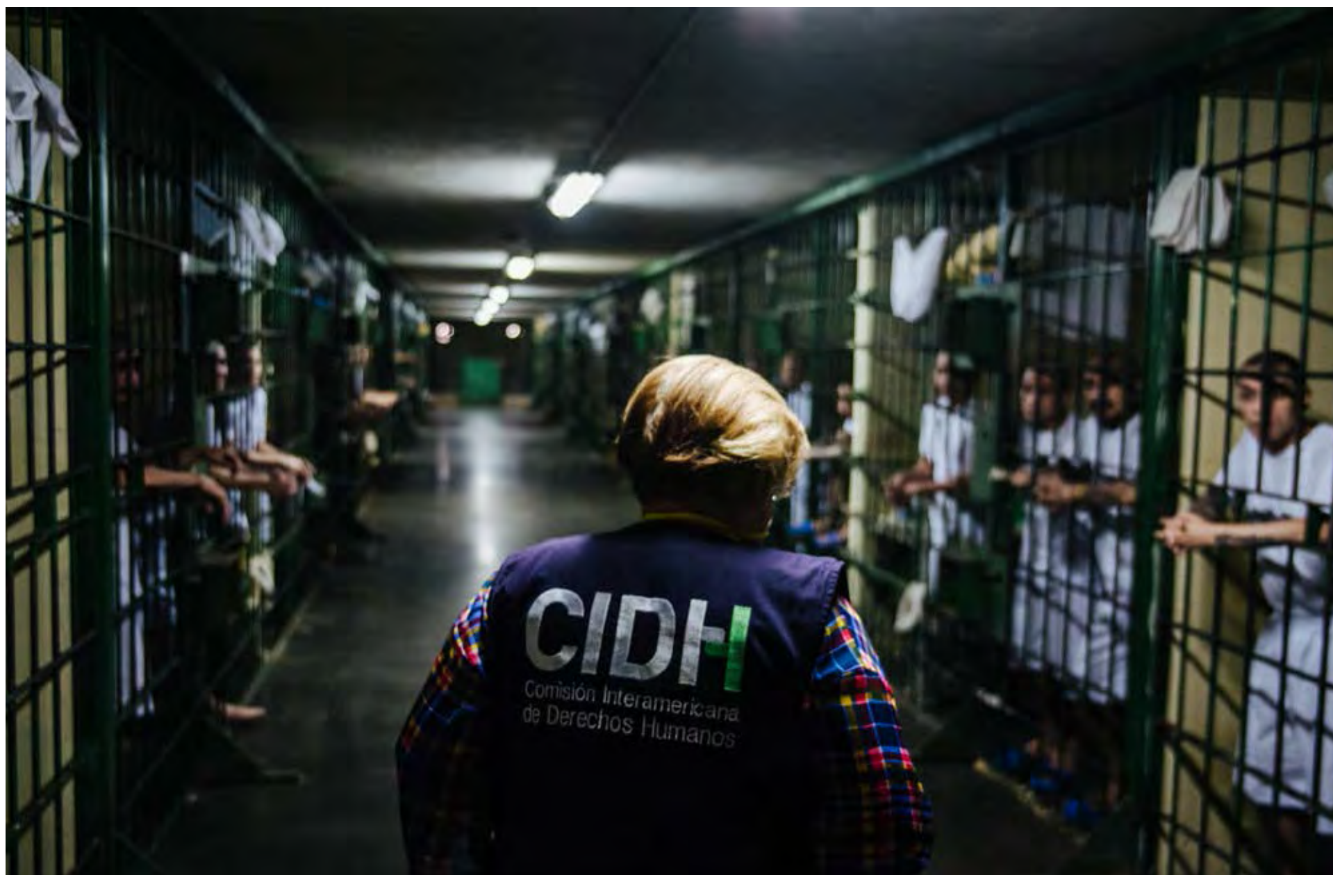
Visita in loco a El Salvador, 2019