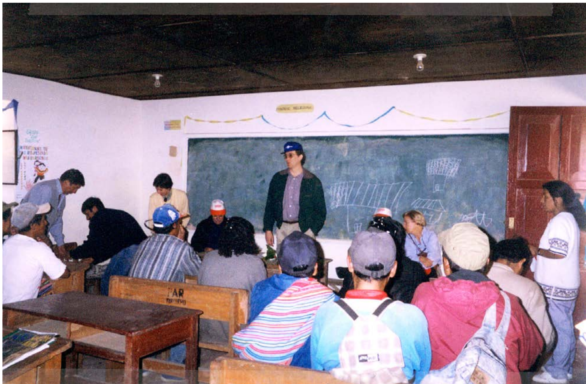
Visita in loco a Perú, 1998