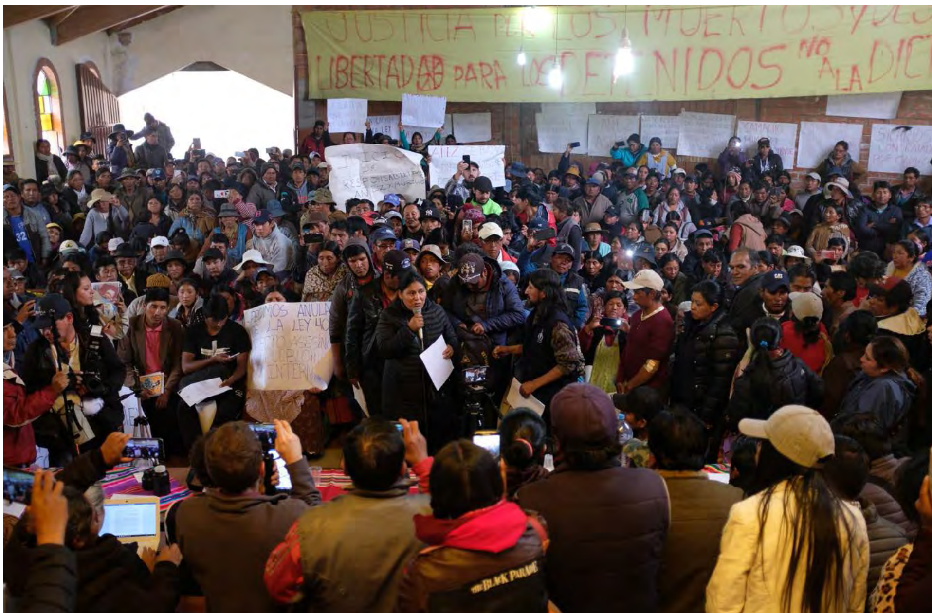
Visita in loco a Bolivia, 2019