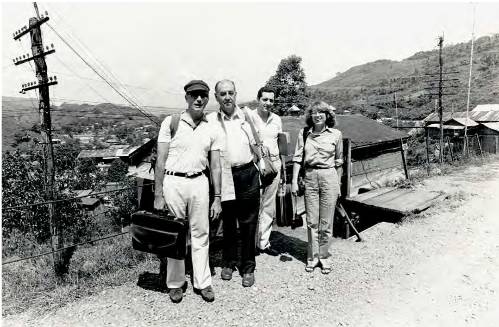
Visita in loco a Nicaragua, 1982