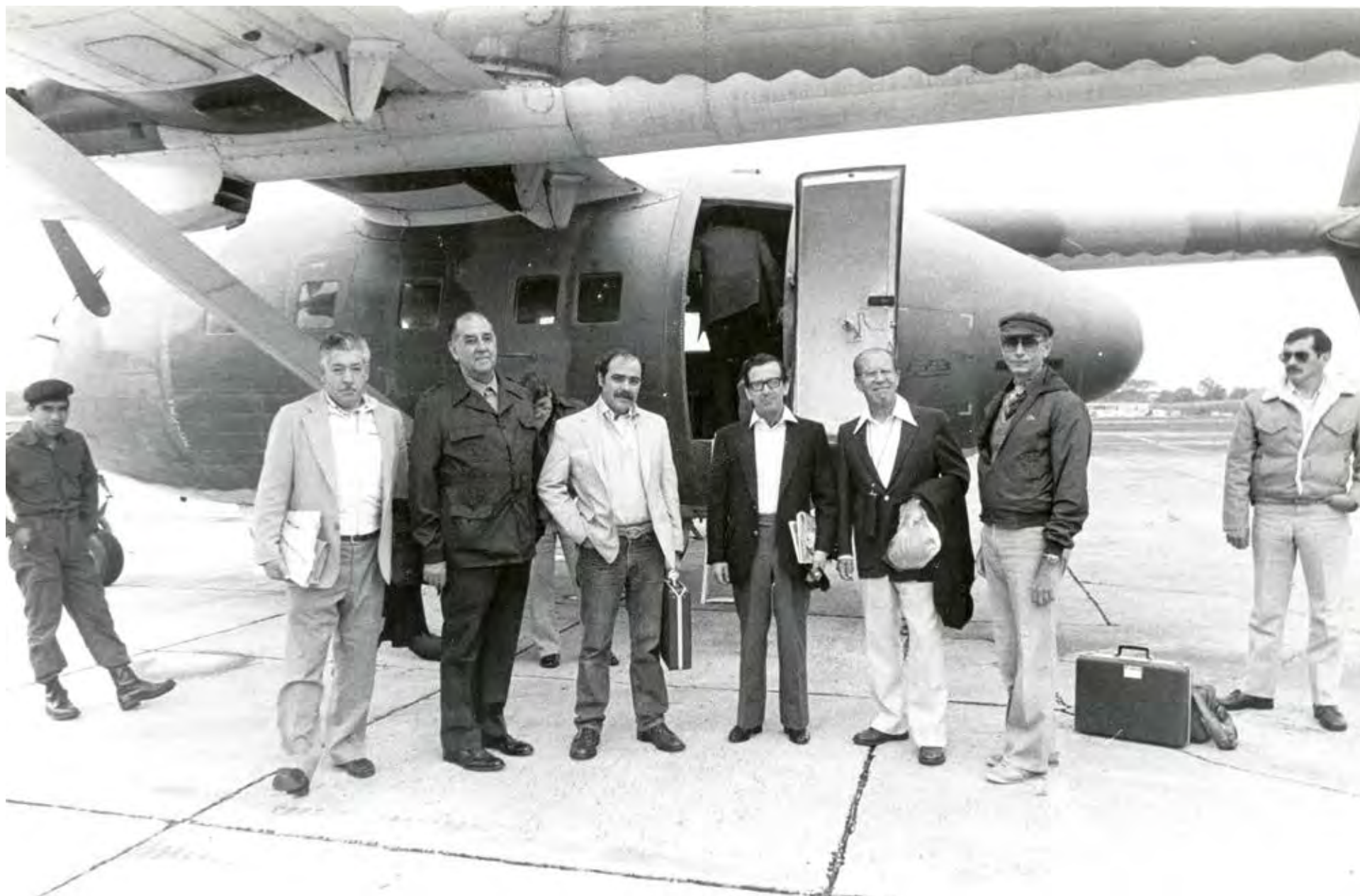
Visita in loco a Guatemala, 1982