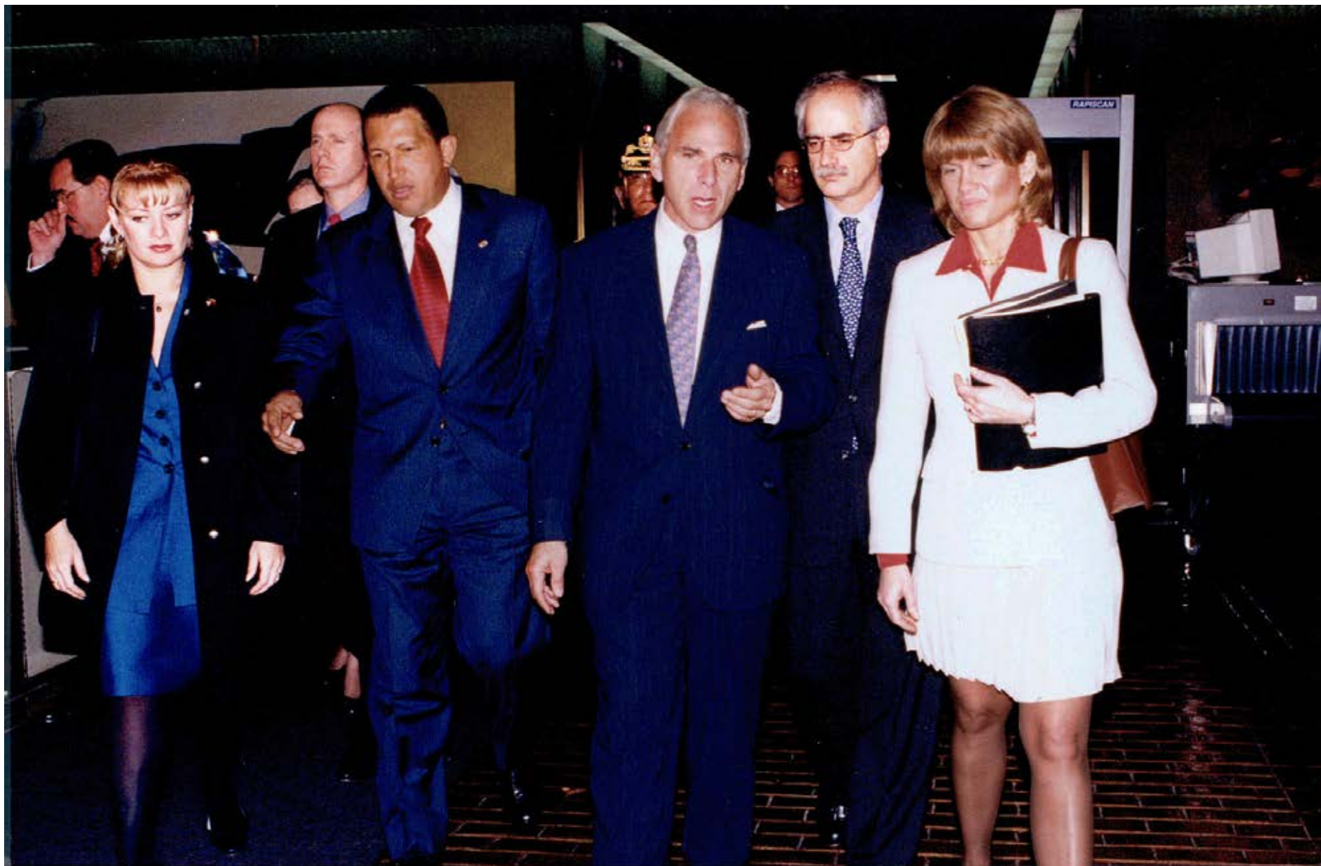
Visita del Presidente de Venezuela a la sede de la CIDH, 1999