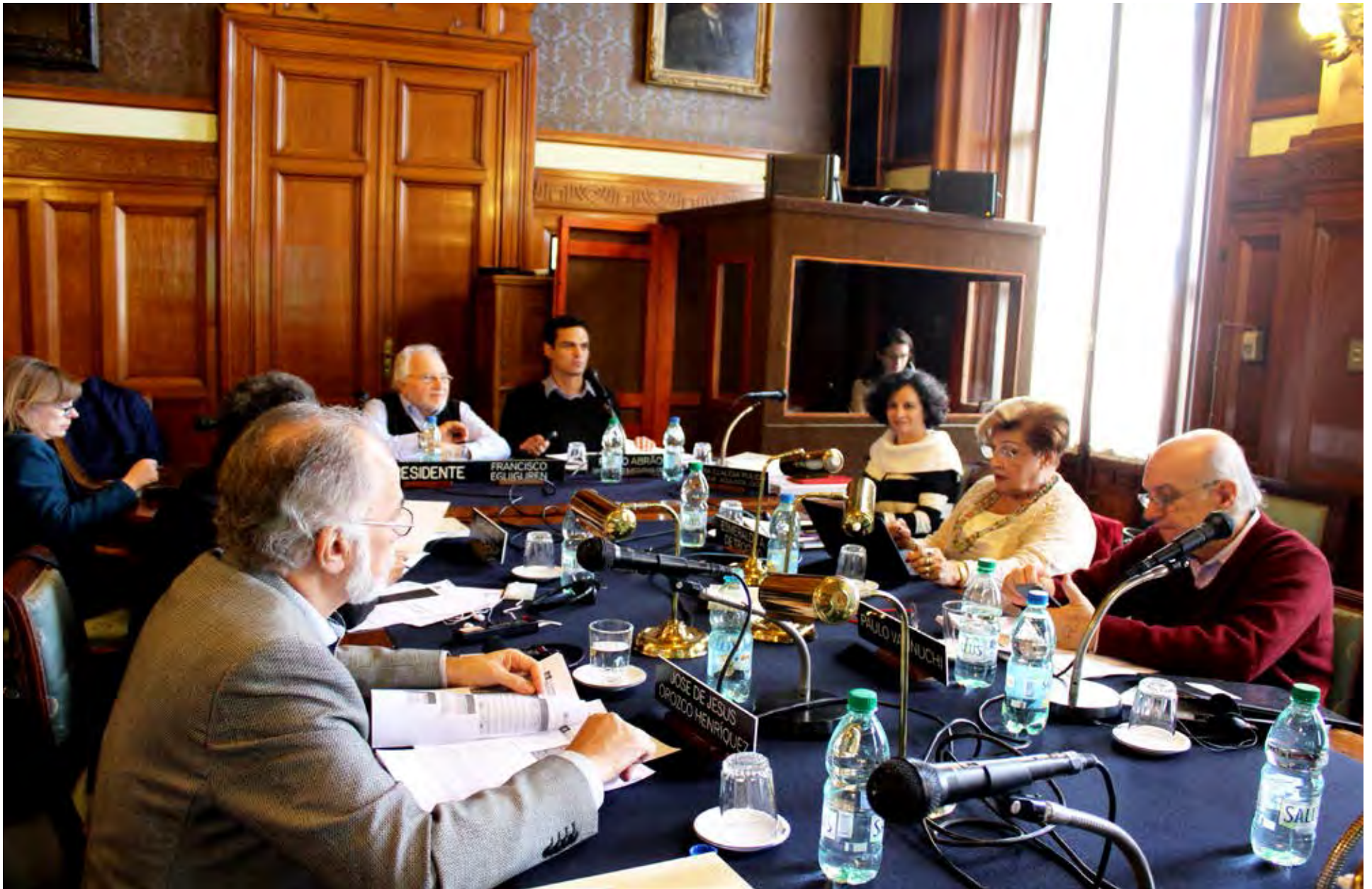
165º período ordinario de sesiones en Uruguay, 2017