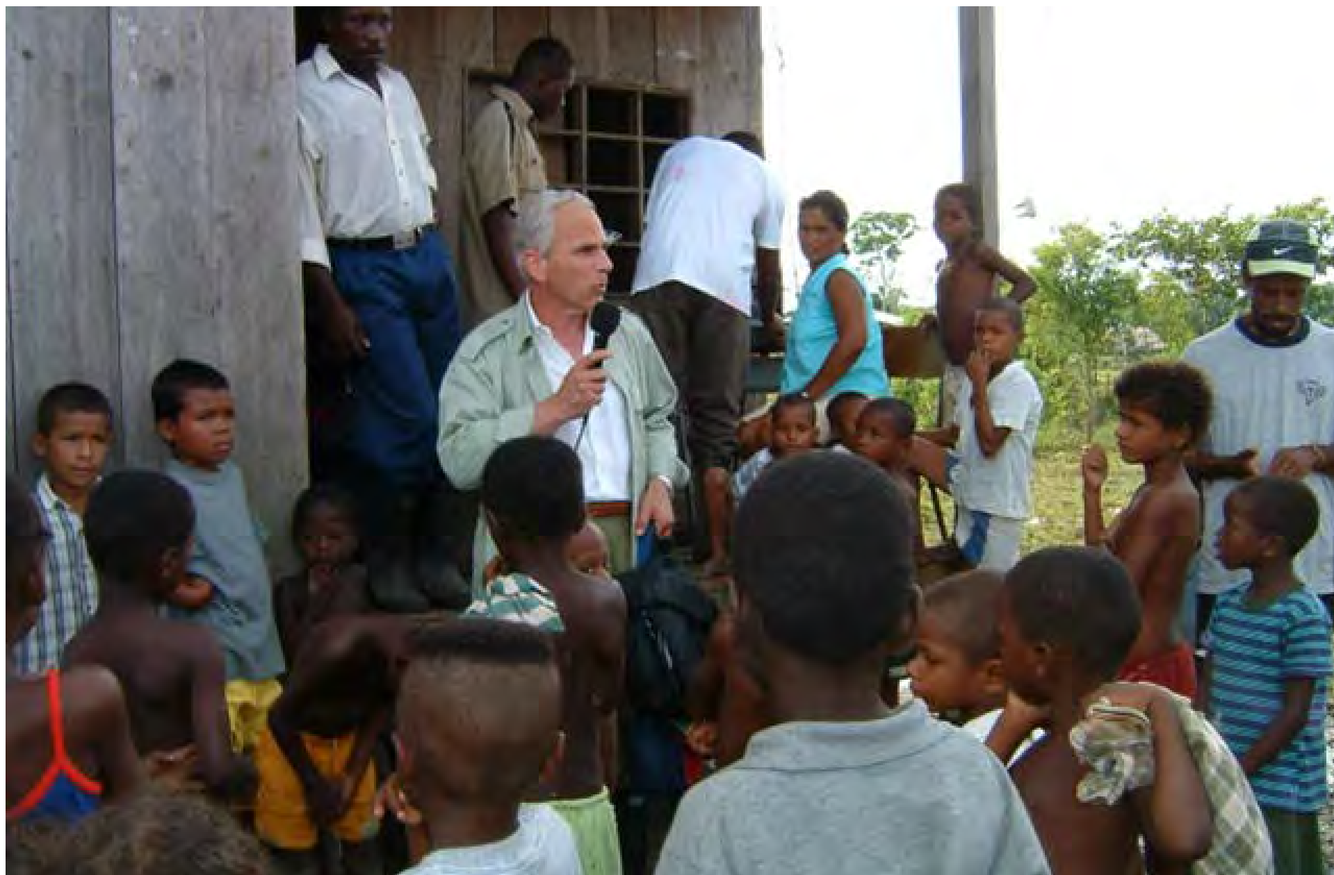
Visita de trabajo a Colombia, 2003