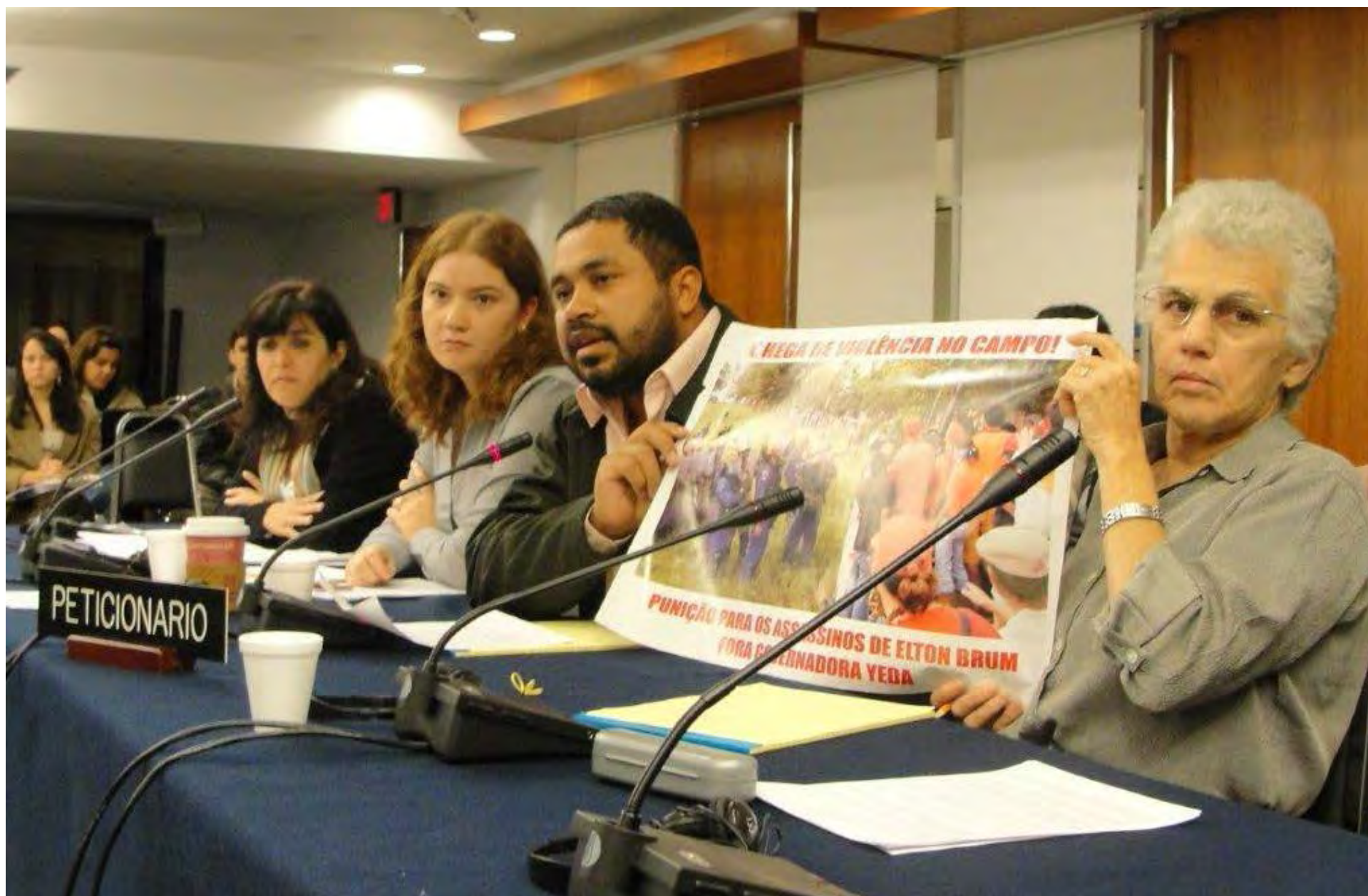
Audiencia sobre la situación de derechos humanos en Brasil, 2009