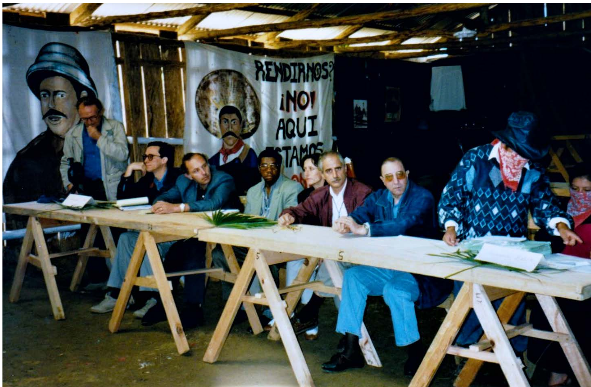
Visita in loco a México, 1996