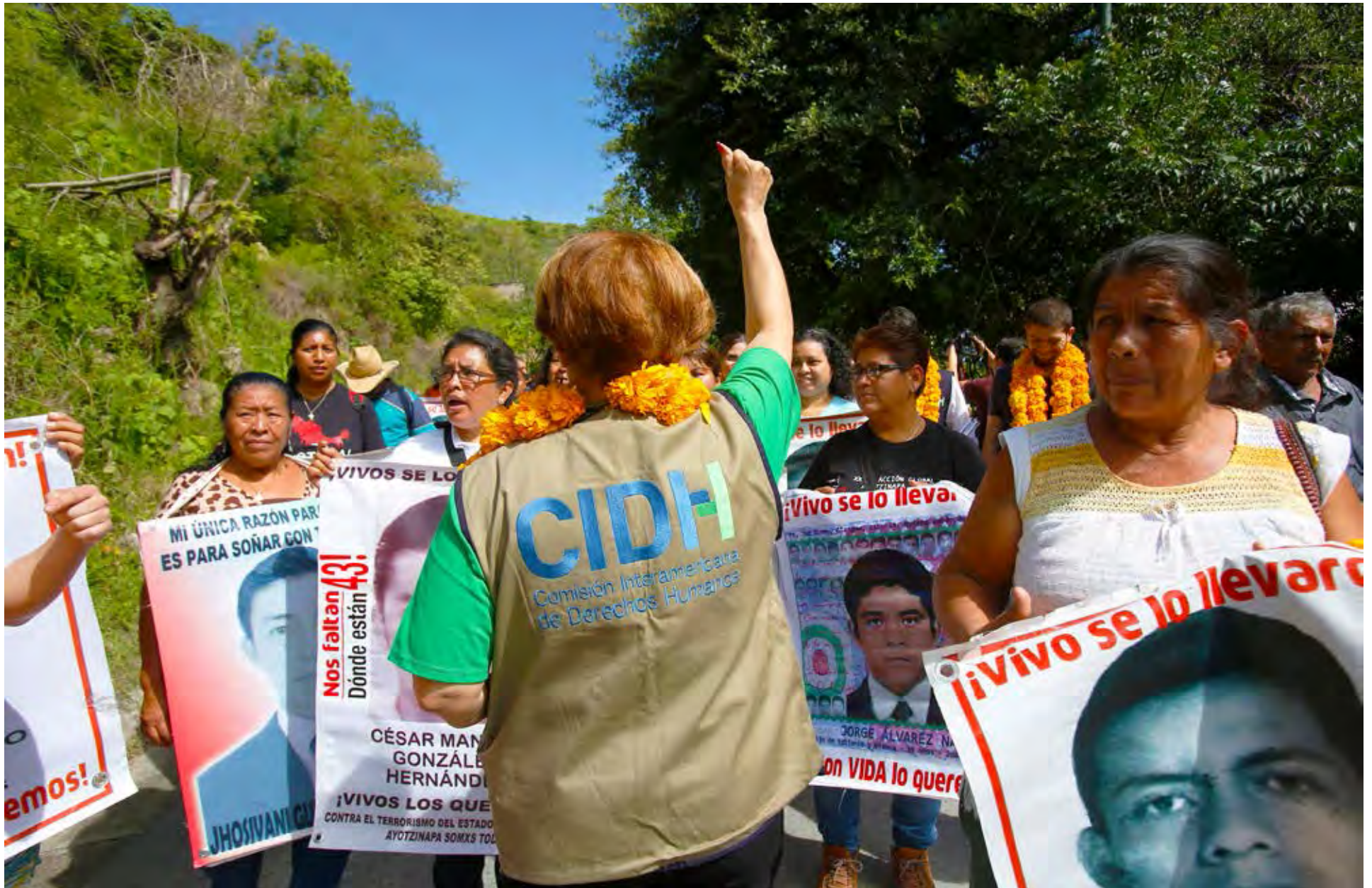
Visita del MESA a México, 2017