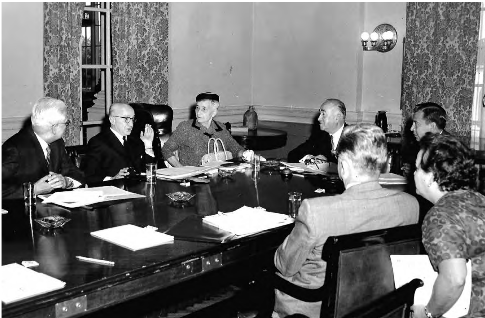
Primera sesión de la CIDH en Washington, D.C., 1960