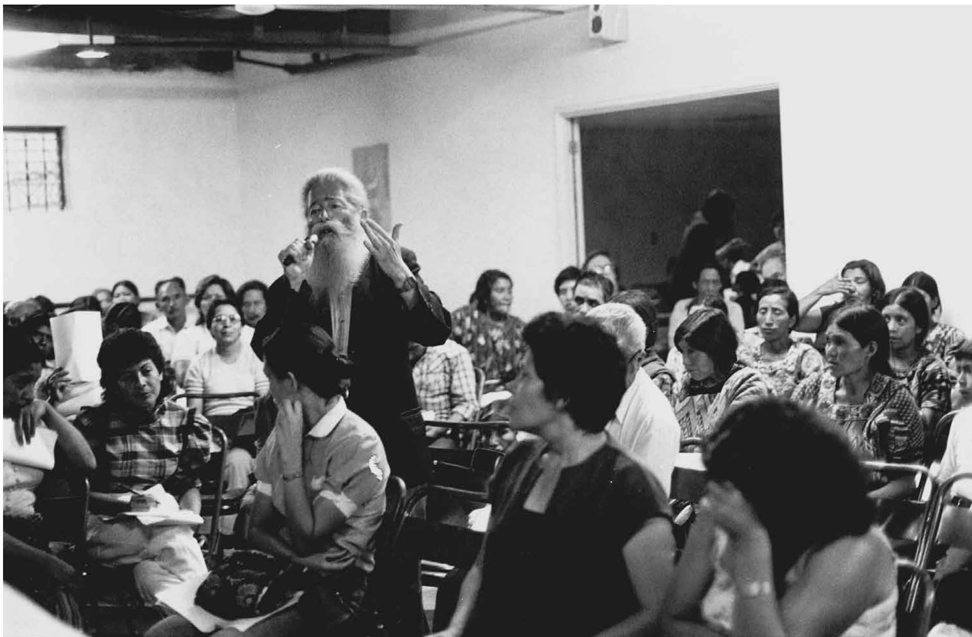
Visita in loco a Guatemala, 1985