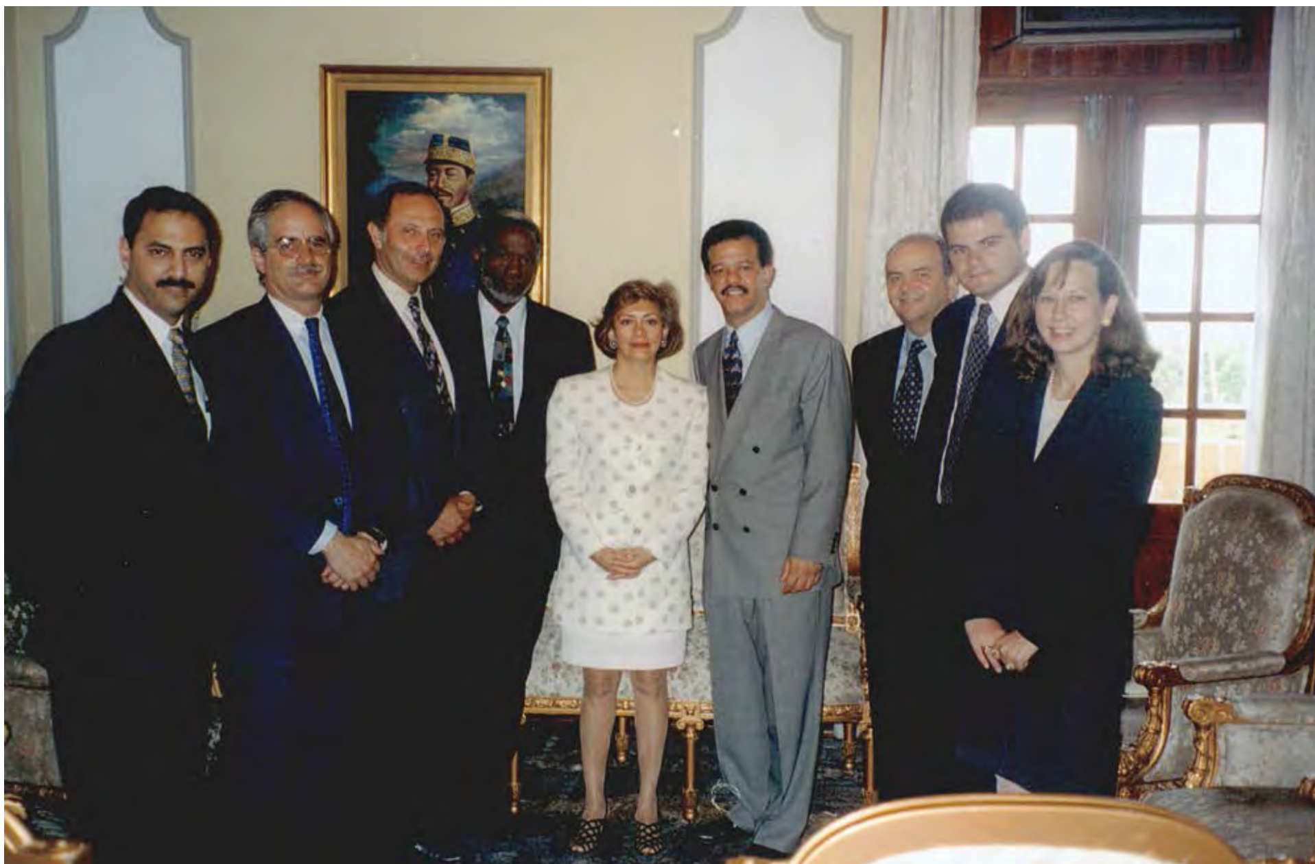
Visita in loco a la República Dominicana, 1997