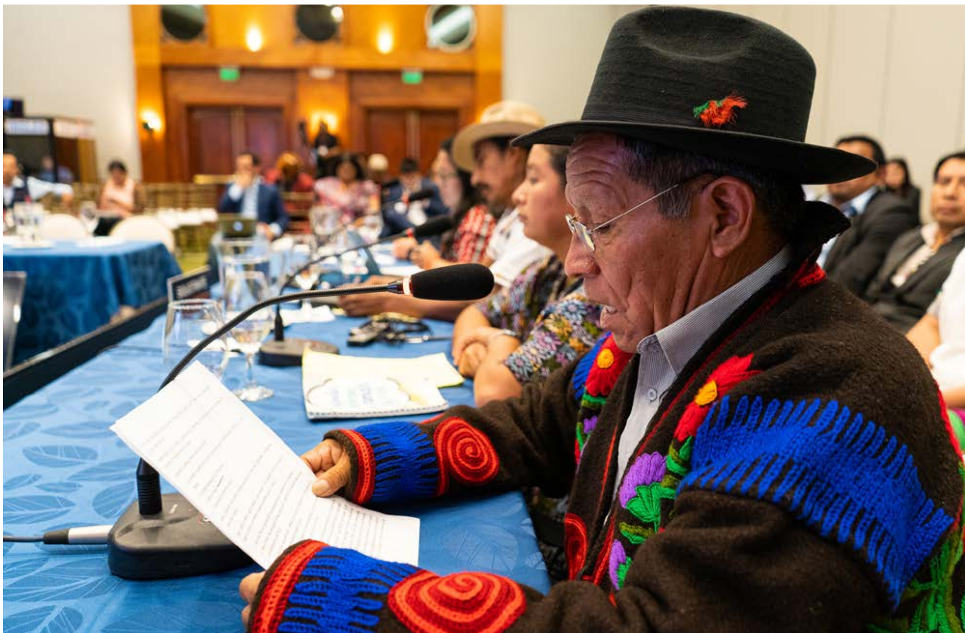
174º periodo de sesiones, Ecuador, 2019