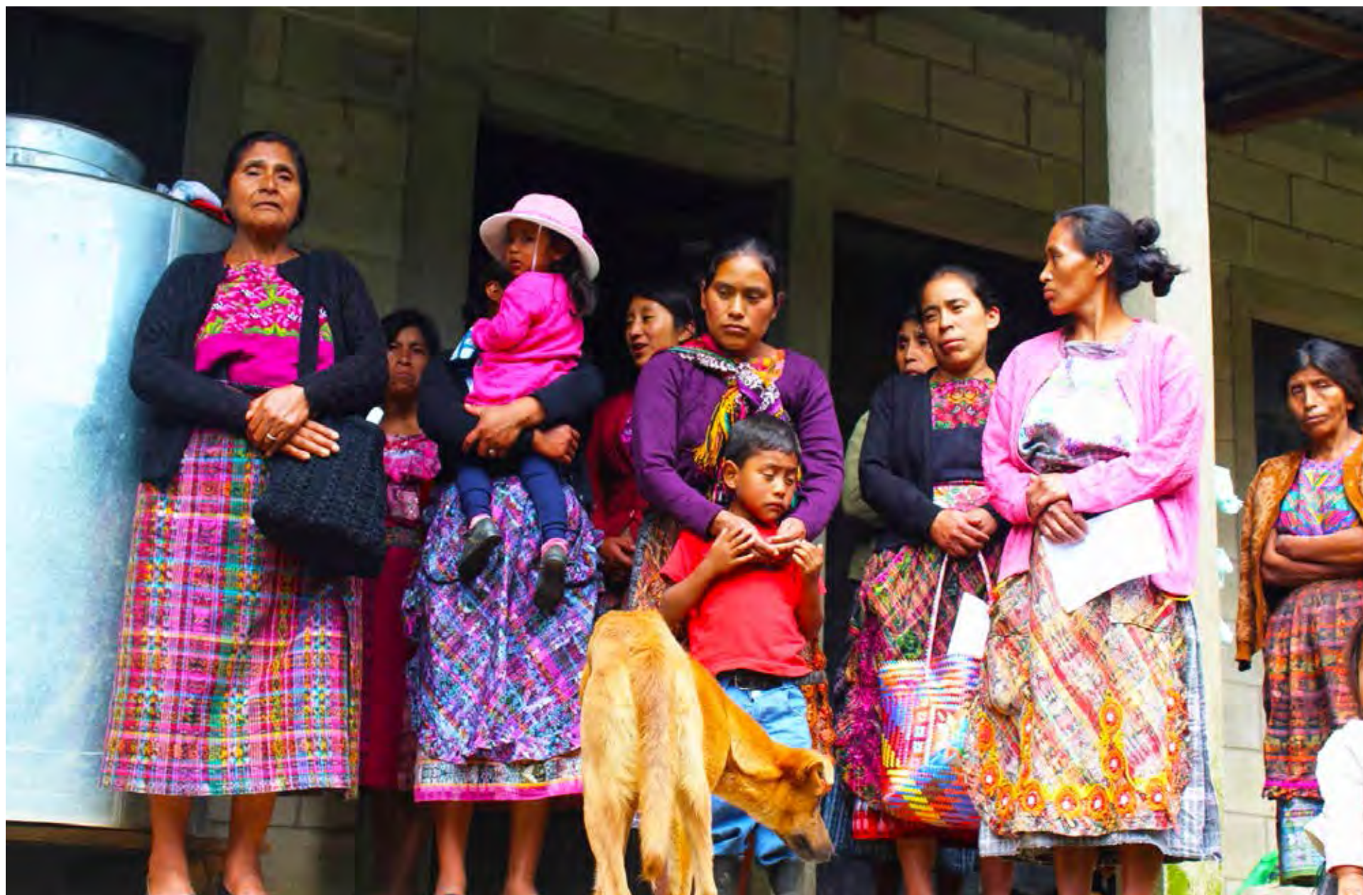
Visita a Guatemala, 2016