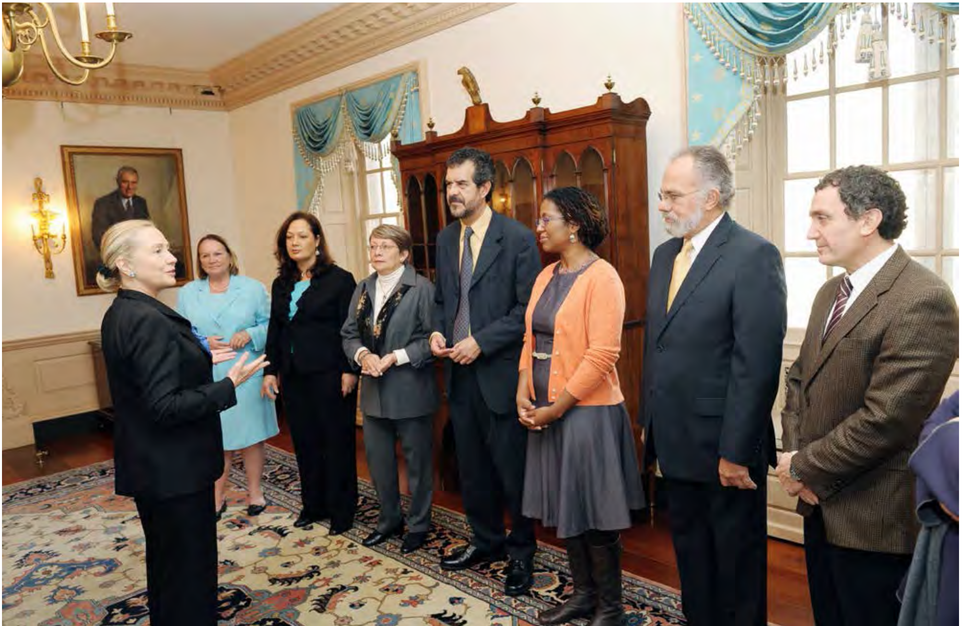
Visita de la CIDH al Departamento de Estado de EE.UU., 2012