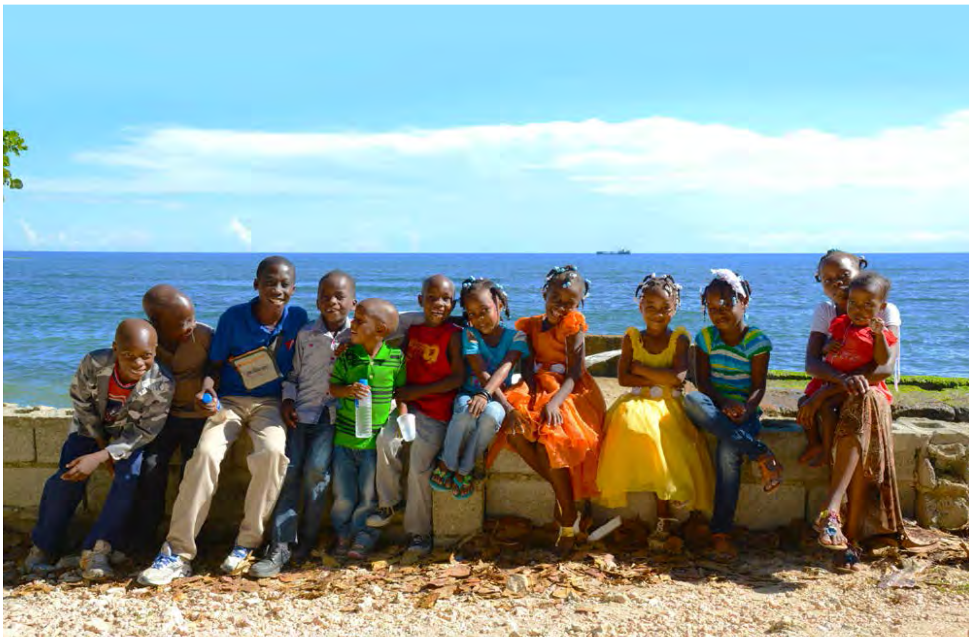
Visita in loco a República Dominicana, 2013