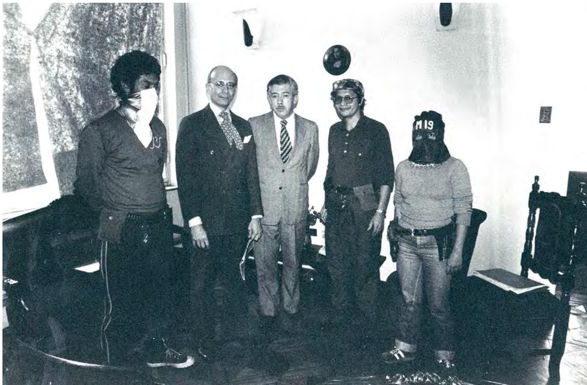
Mediación entre el M-19 y Colombia, 1980