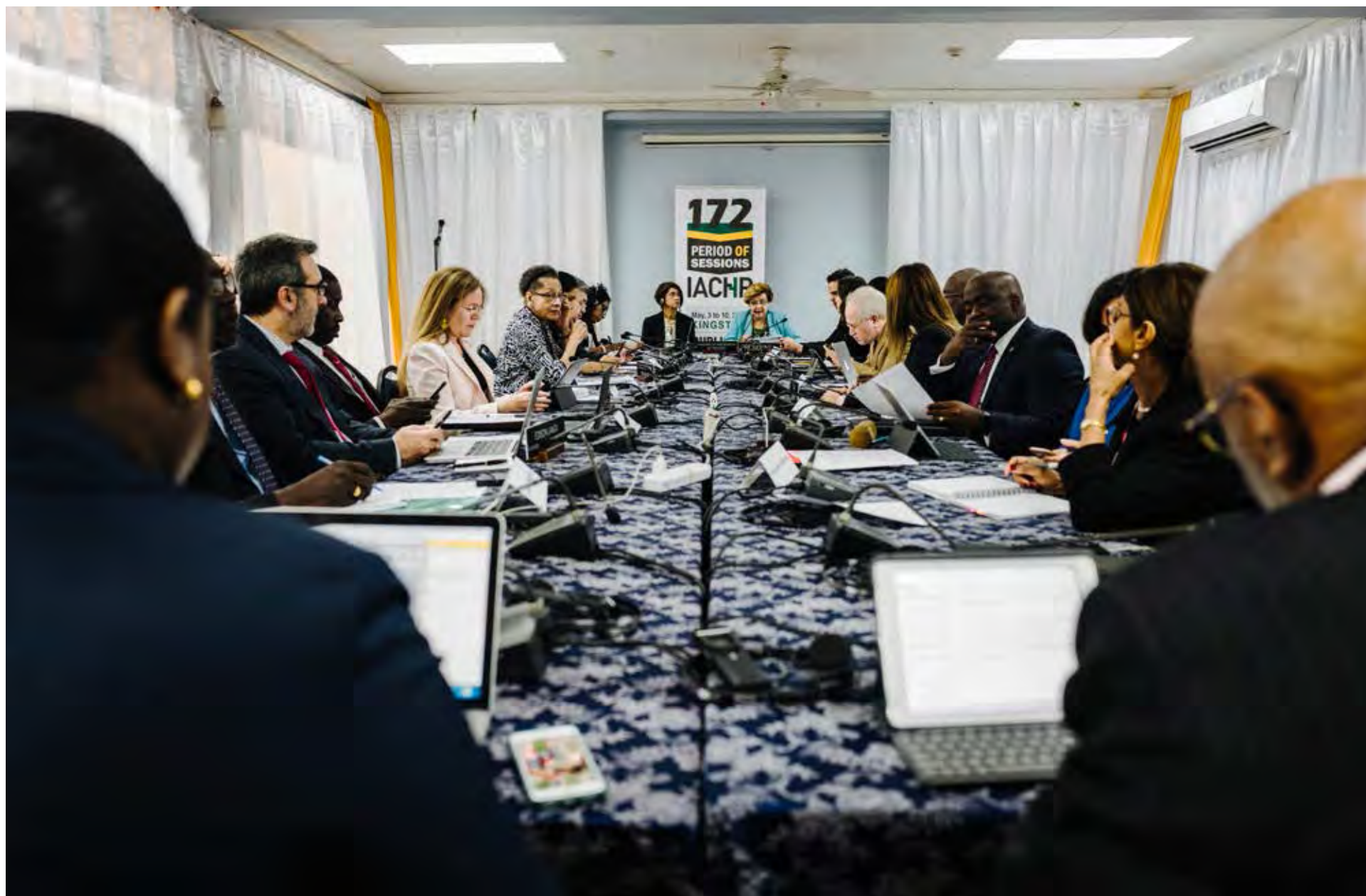
172º periodo extraordinario de sesiones en Jamaica, 2019