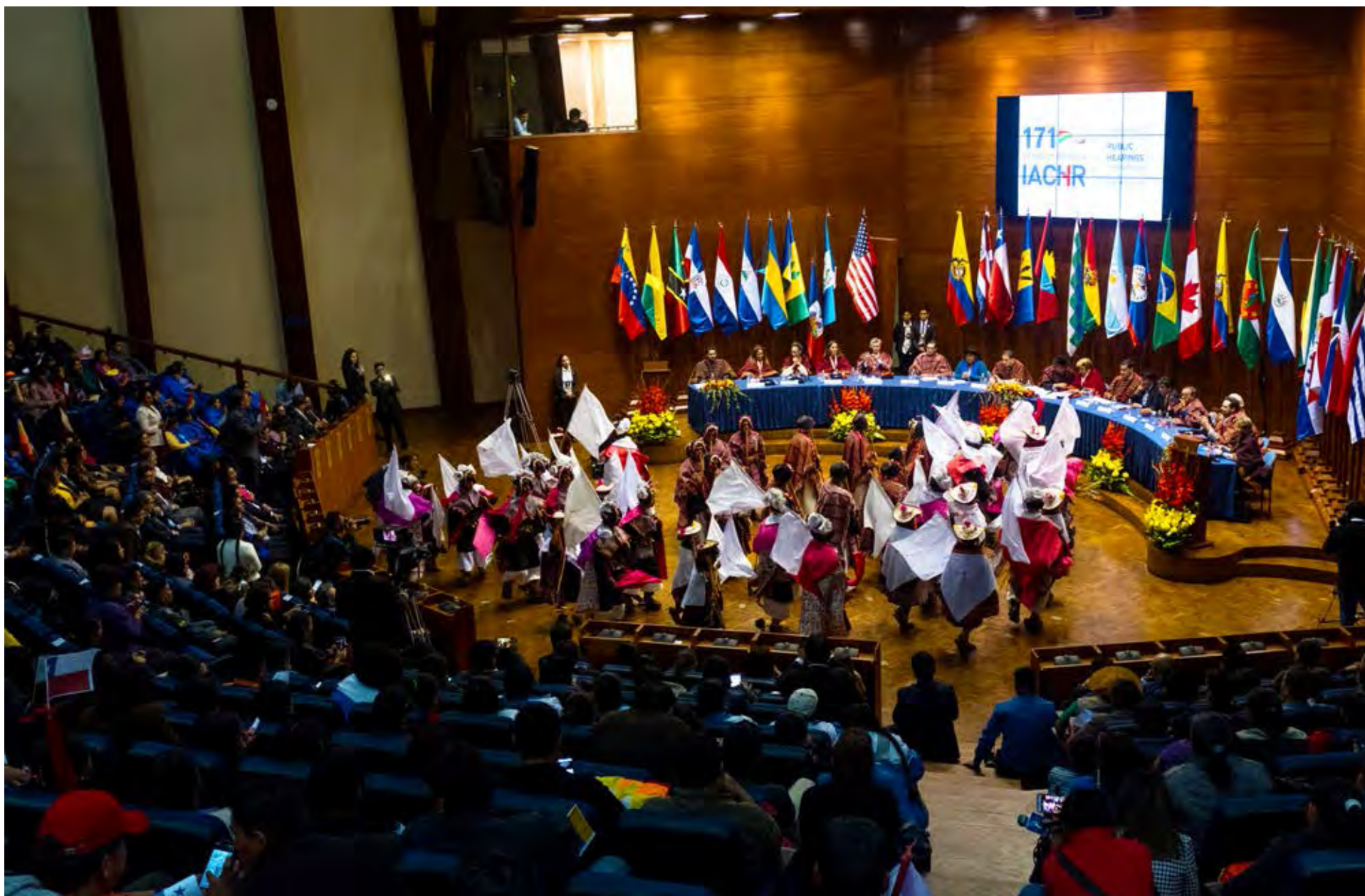
171º periodo extraordinario de sesiones en Bolivia, 2019