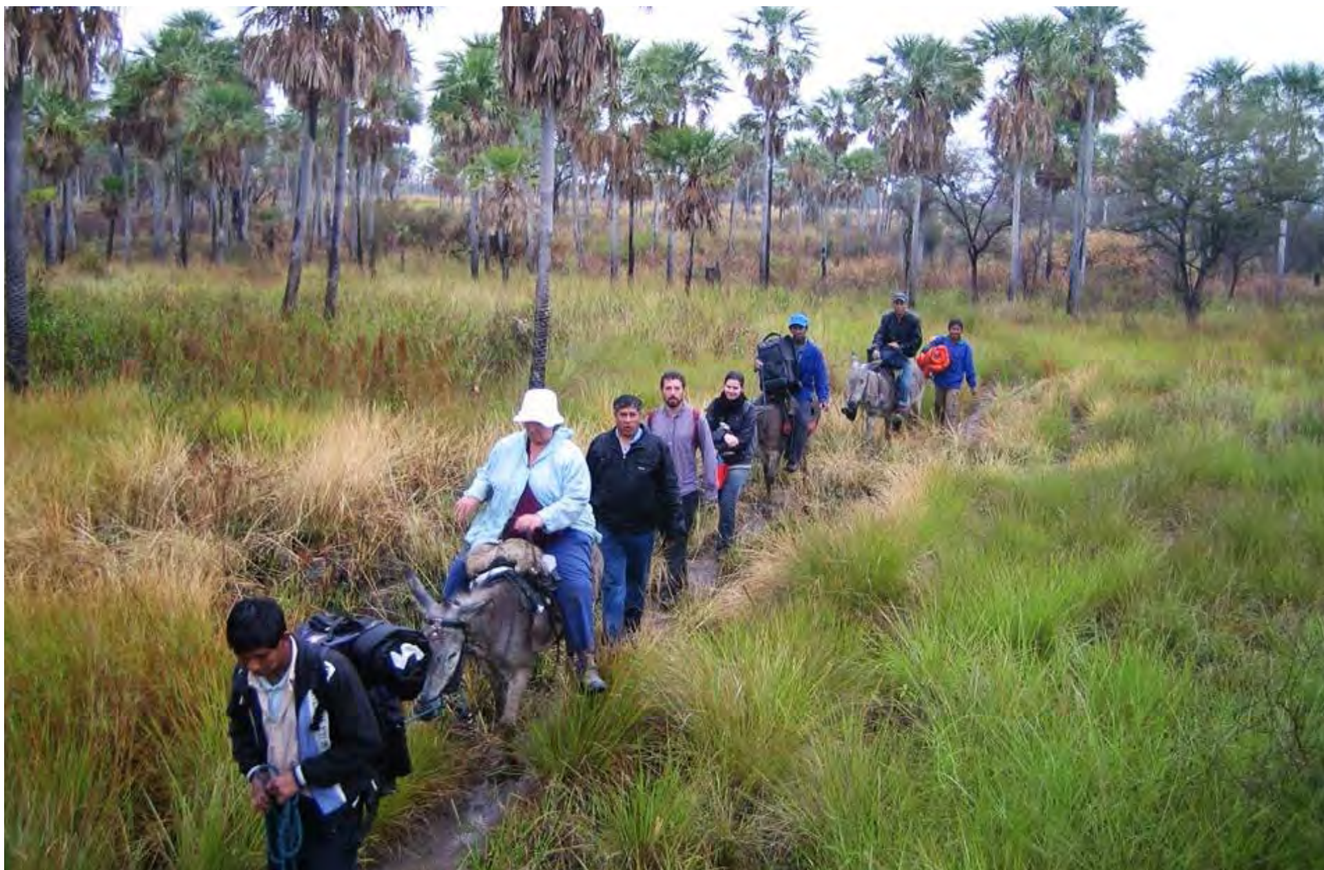
Visita de trabajo a Paraguay, 2010