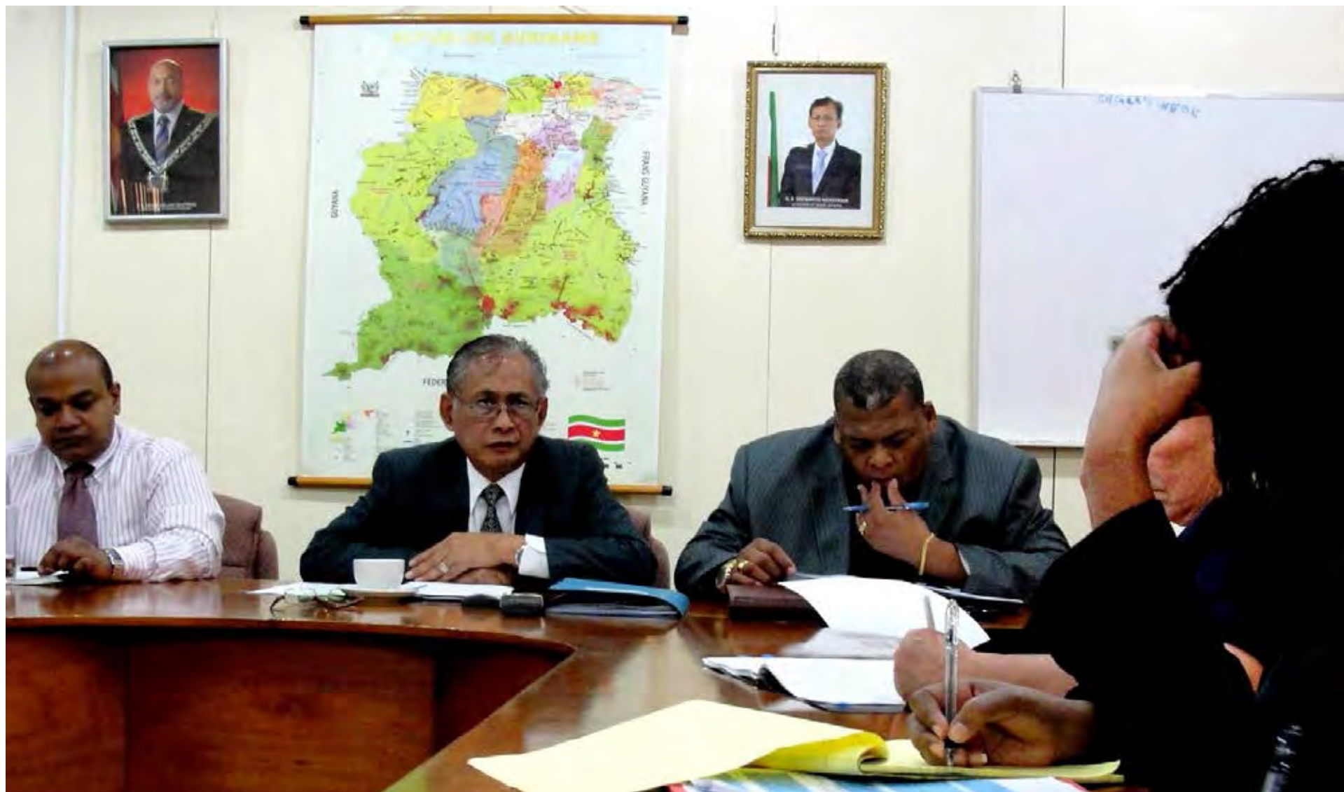
Visita de trabajo a Surinam, 2013