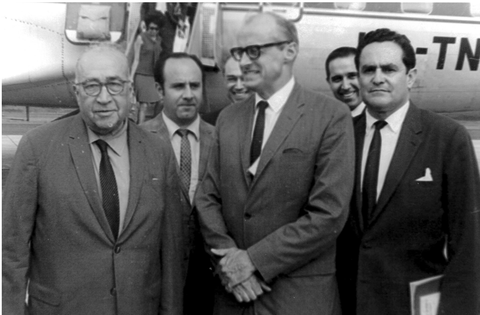
Visita in loco a la República Dominicana, 1965