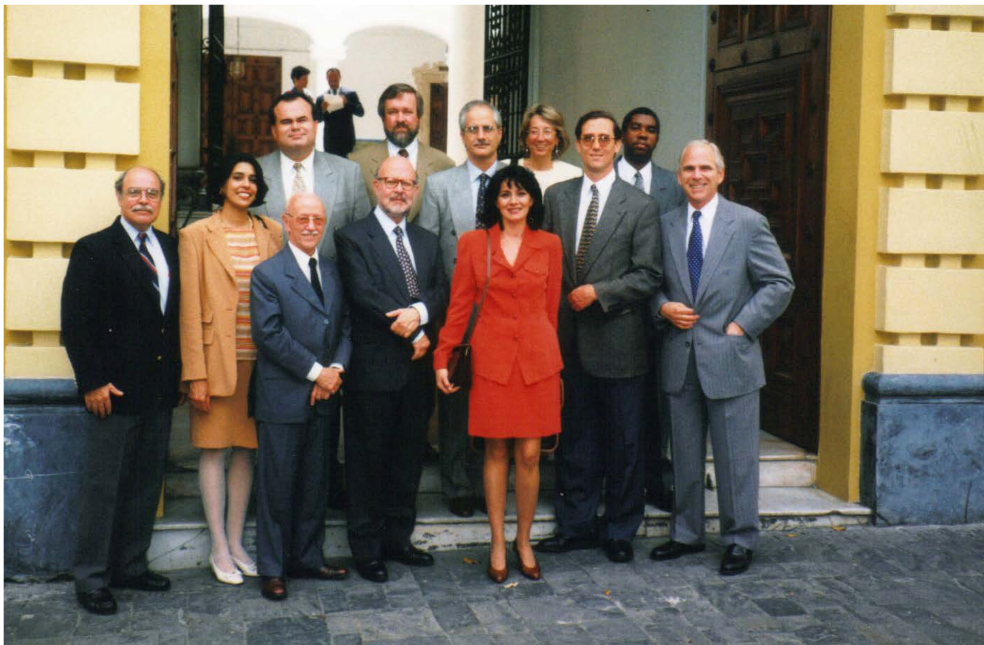
99º periodo extraordinario de sesiones en Venezuela, 1998