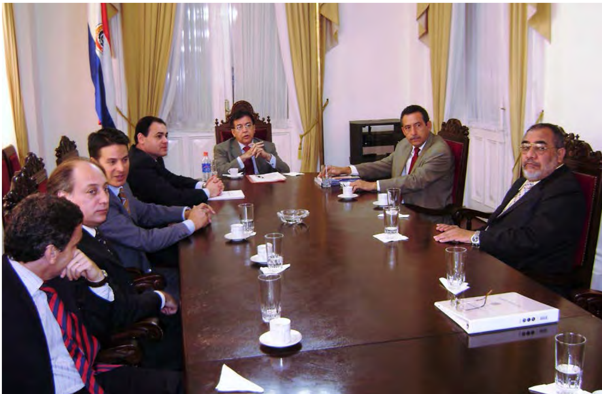
129º período extraordinario de sesiones en Paraguay, 2007