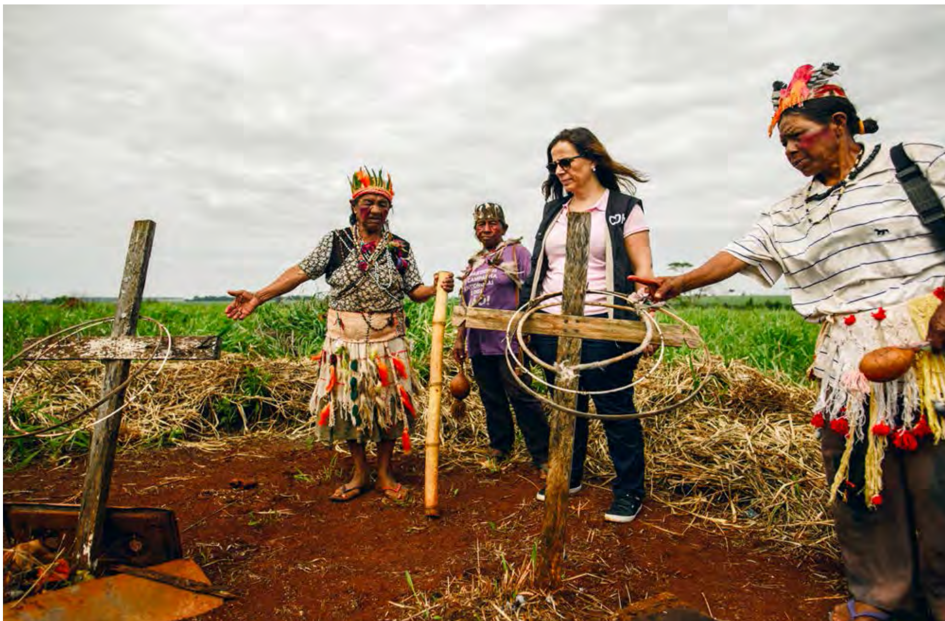
Visita in loco a Brasil, 2018