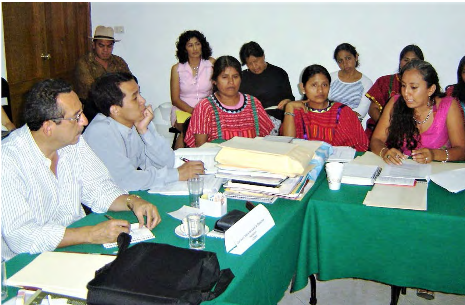
Visita de trabajo a Oaxaca, México, 2007