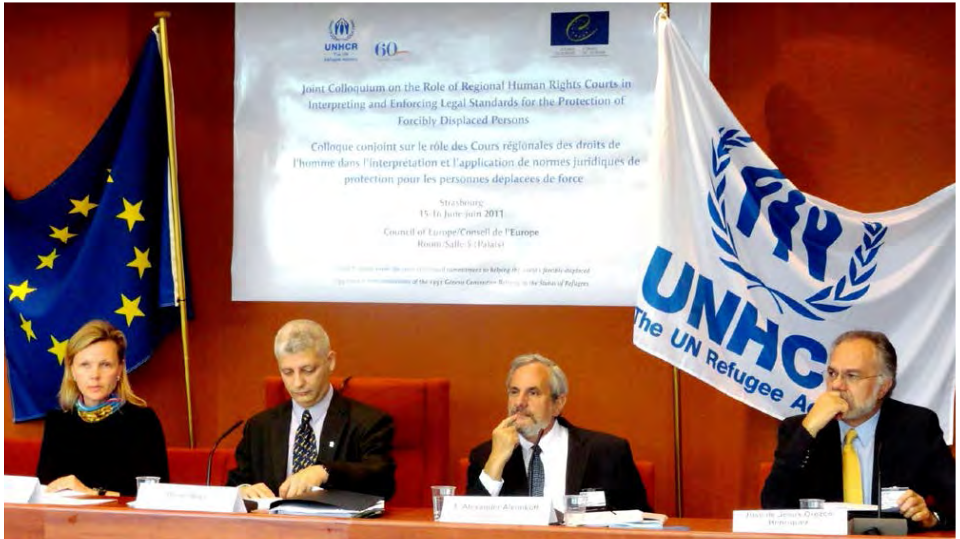
Coloquio sobre personas desplazadas, Francia, 2011