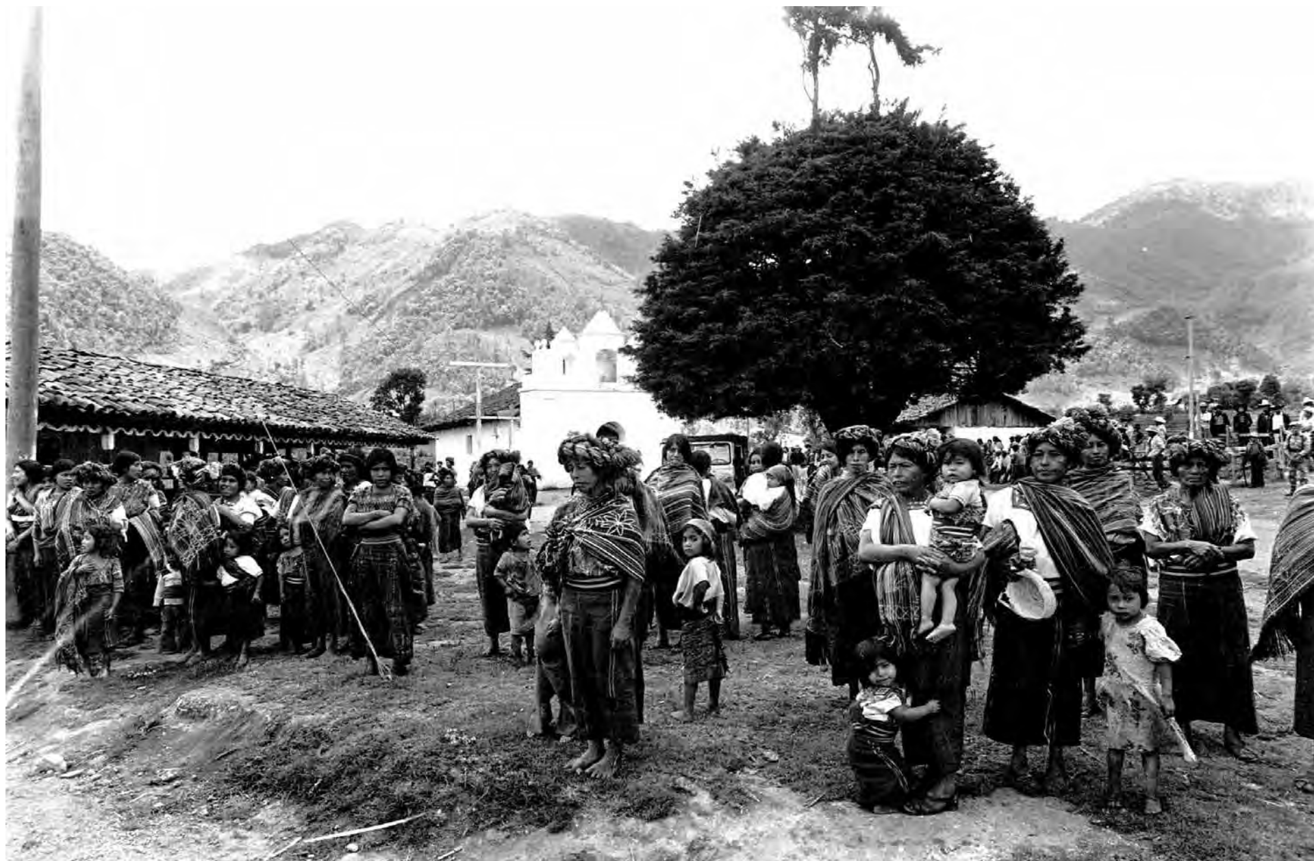
Visita in loco a Guatemala, 1995