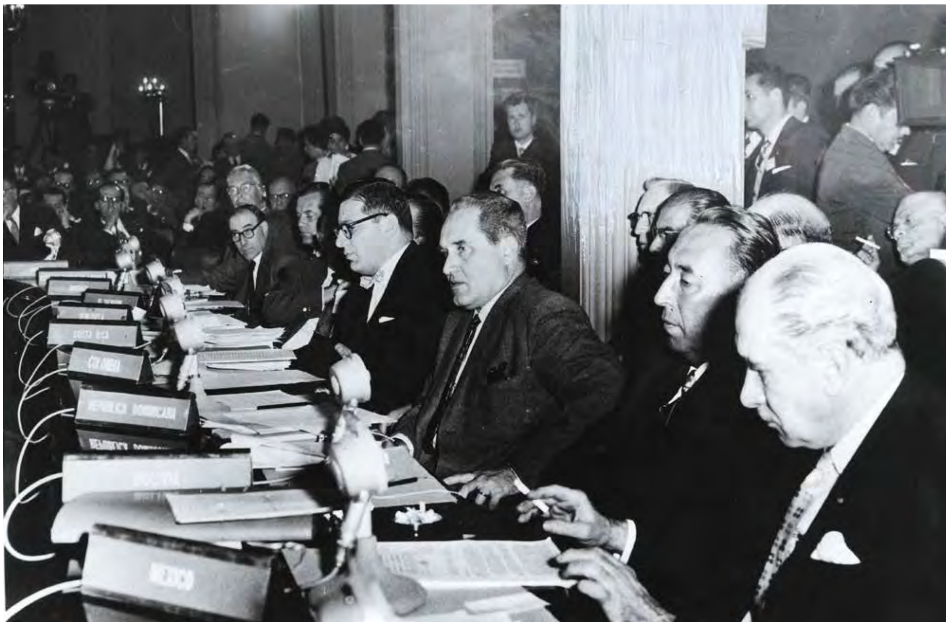
Creación de la CIDH en Santiago de Chile, 1959