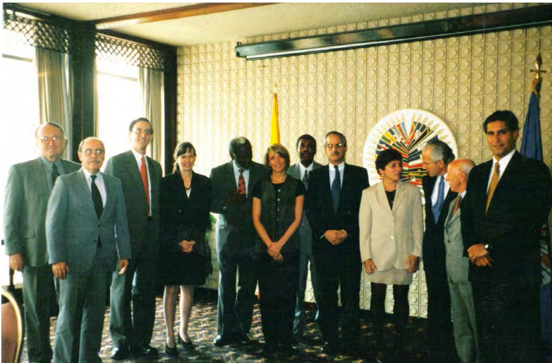
Visita in loco a Colombia, 1997