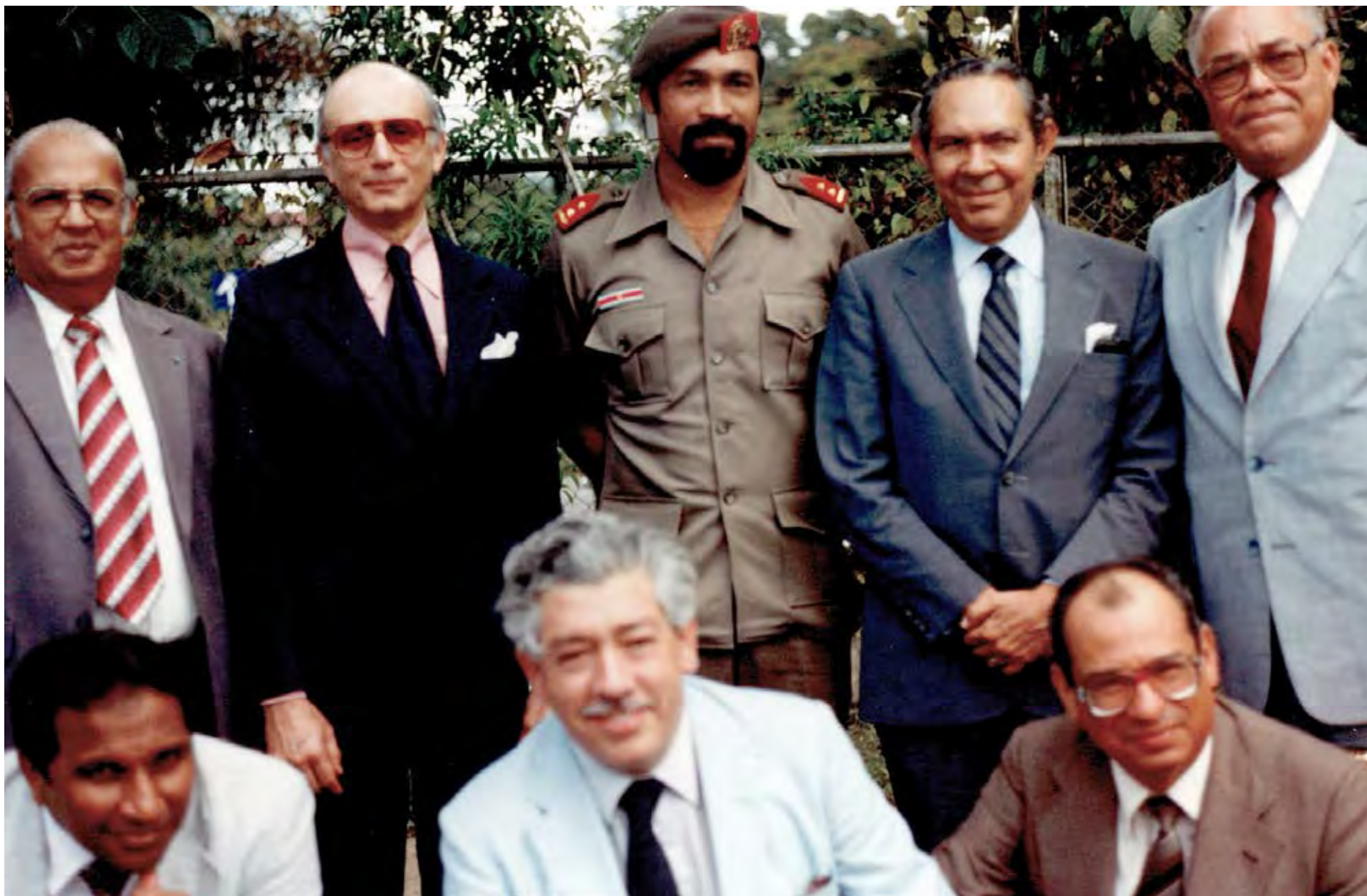
Visita in loco a Surinam, 1983