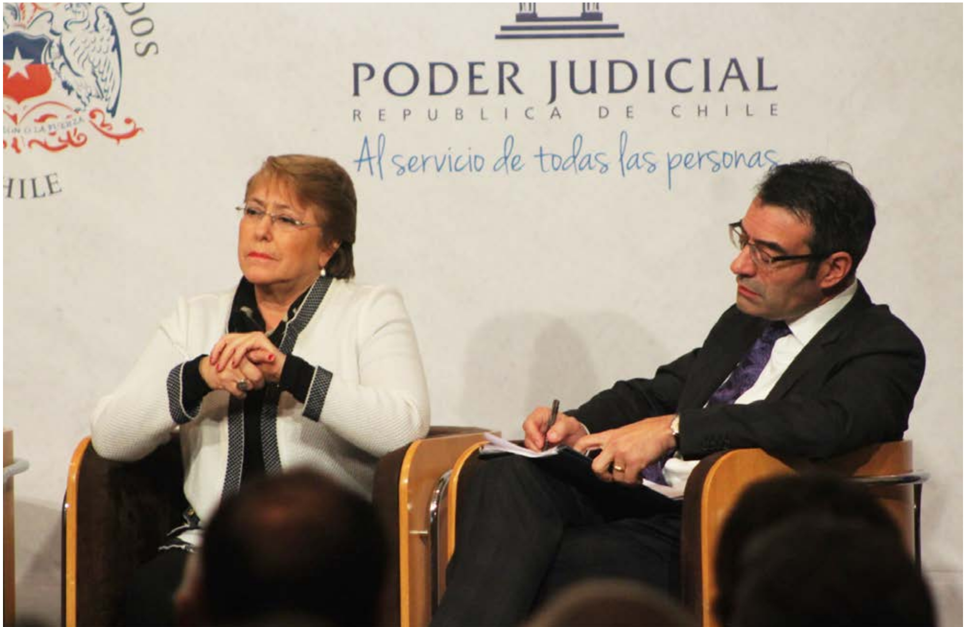
158º periodo extraordinario de sesiones en Chile, 2016