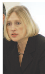
Elizabeth Spehar Primera Jefa de MOE/OEA

◆ 2009 Primer Piloto Metodología para la Observación de Medios de Comunicación en las Misiones de Observación Electoral de la OEA