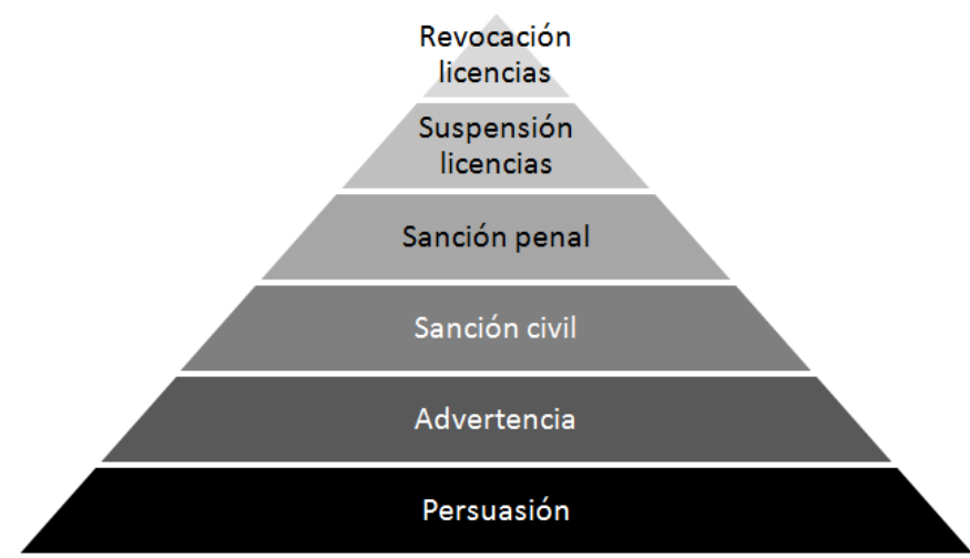
Pirámide de sanciones