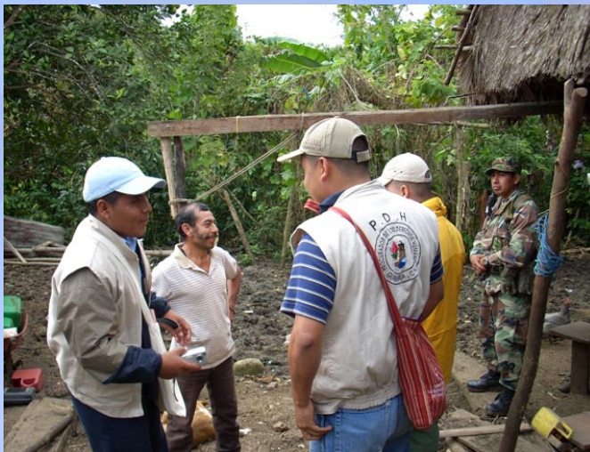
Apoyo Derechos Humanos de Guatemala