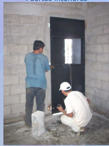
Instalación de Puerta principal