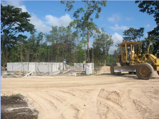
Conformación calle central