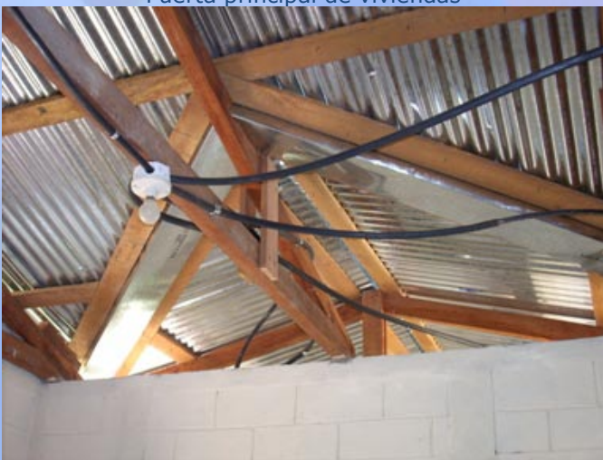
Techo de las viviendas con instalación eléctrica