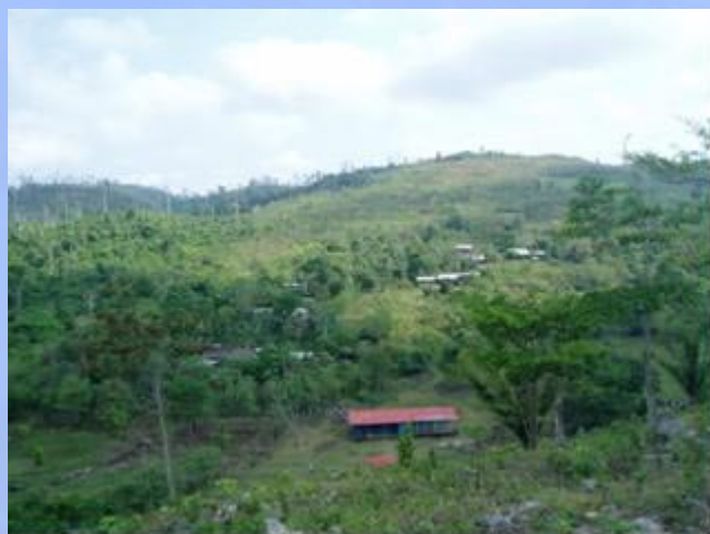
Vista panorámica Santa Rosa