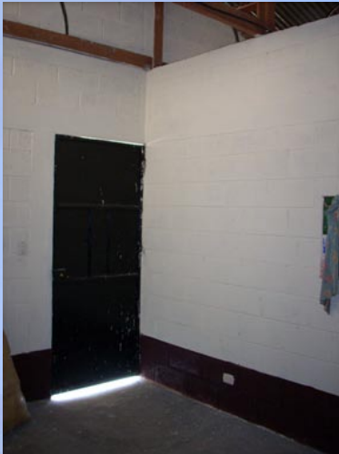
Puerta principal de viviendas