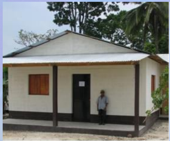
Vivienda actual de Pedro Pascual