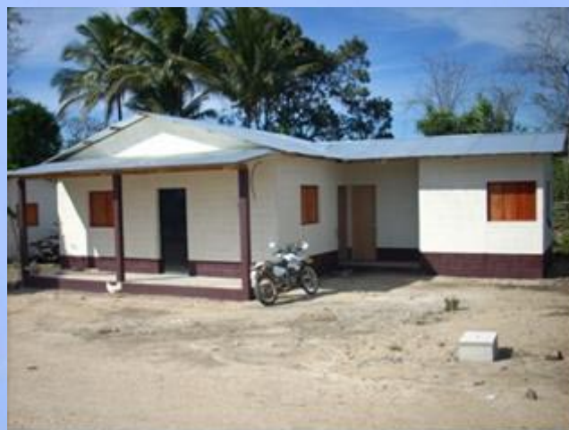
Vivienda de uno de los beneficiarios