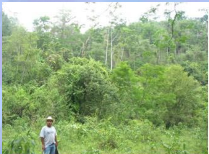
Bosque en Finca La Esmeralda