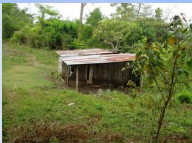
Vista vivienda en Santa Rosa Z.A.