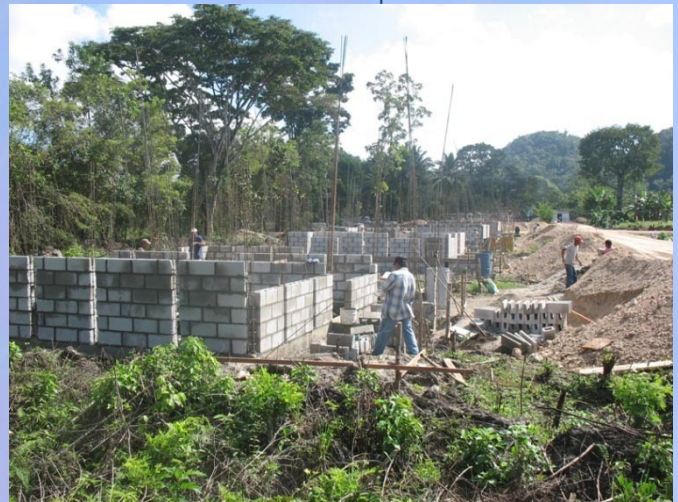
Vista frontal de construcción