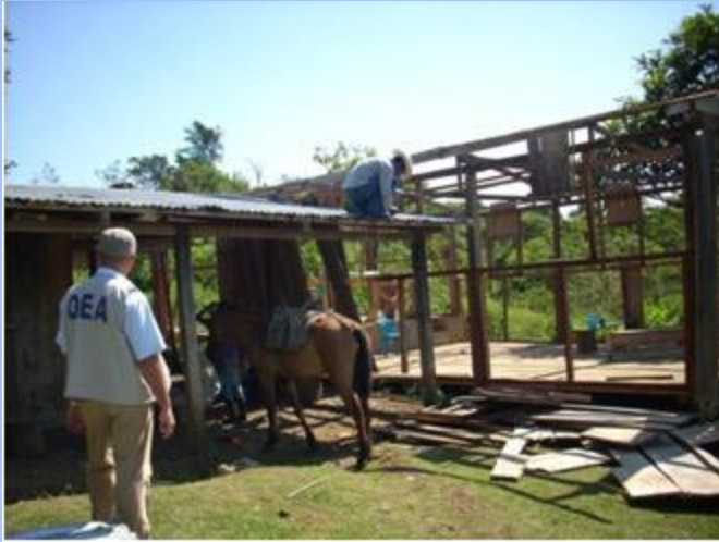
Desmantelamiento de vivienda