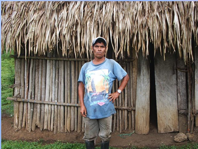
Vivienda anterior de Pedro Pascual