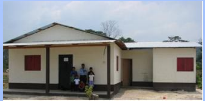
Vivienda actual de Leonzo Ramírez