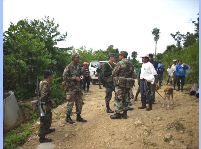
Apoyo militares de Belice y Guatemala