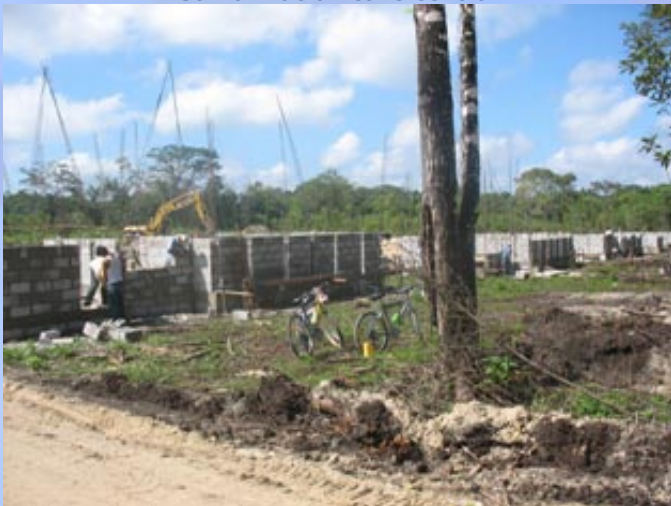
Vista trasera de construcción