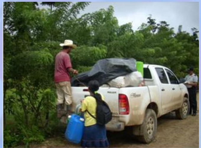
Traslado de pertenencias