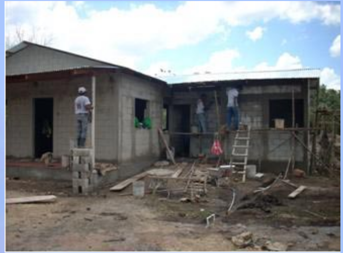
Construcción de vivienda en su fase final