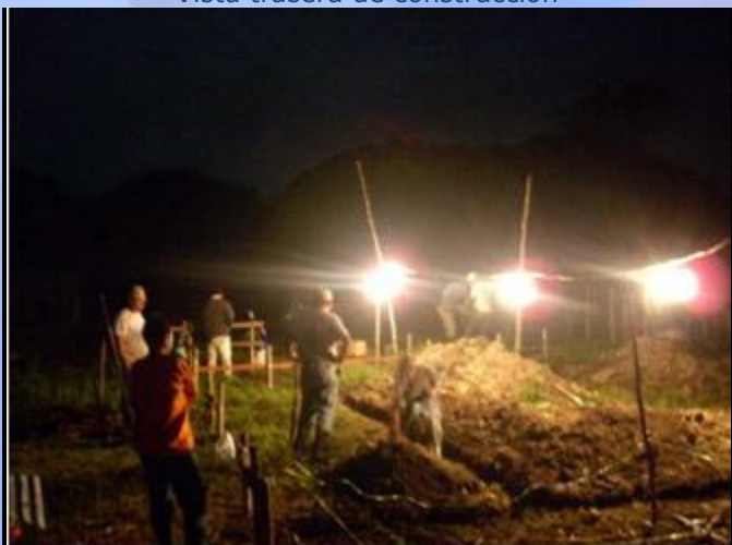
Trabajo en horas nocturnas