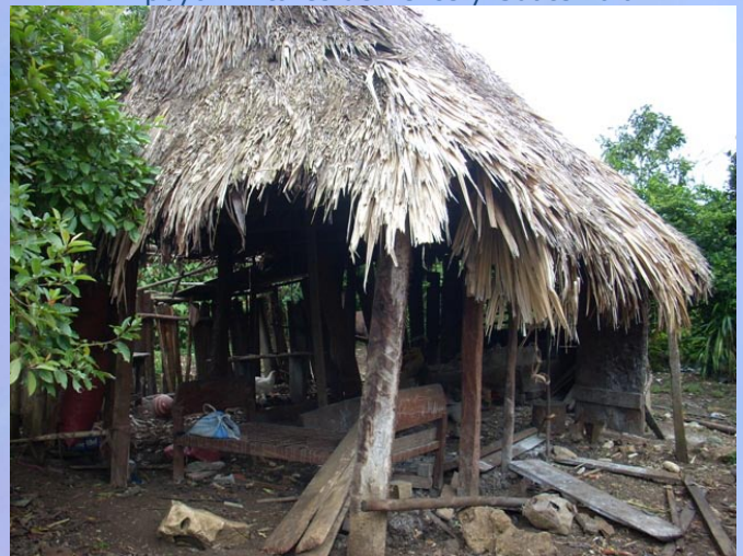
Desmantelamiento de vivienda