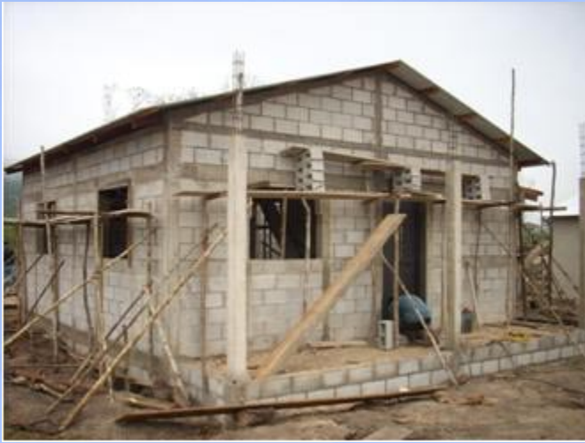
Construcción de vivienda en su fase final