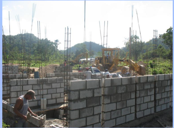
Levanto de paredes