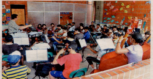
ENSAYOS. A diario, 90 niños y jóvenes le dedican dos horas de ensayo a la orquesta juvenil e infantil de la Fundación Notas de Paz.